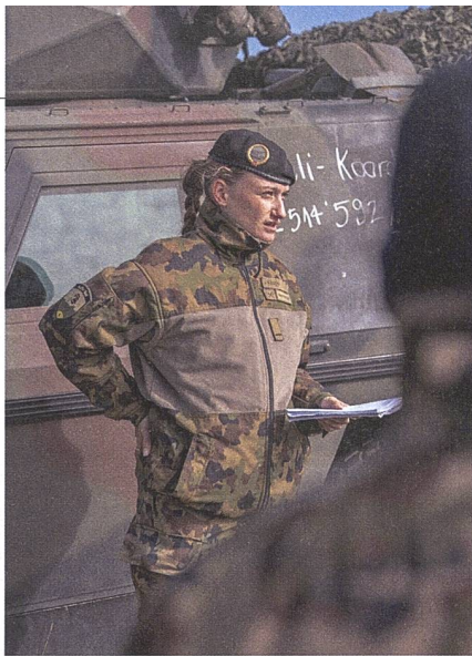
Sicherheitsrapport vor dem MG-Schiessen durch Zfhr.