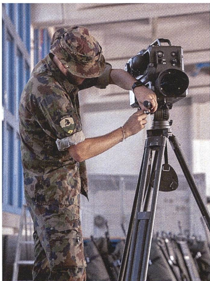
Wm beim Installieren des WBG 90.

Die Erfahrung, welche ich als Zugführer machen konnte, haben mir einen anderen Einblick in die Auftragserfüllung gegeben. Nicht alles verlief nach Plan und vieles musste innert kürzester Zeit angepasst werden. Mein persönliches Fazit: Es ist schwer, mit den jetzigen Mitteln in einem Einsatz zu bestehen bzw. den Auftrag zu erfüllen. Jedoch konnte ich als Zugführer von den gemachten Erfahrungen sehr profitieren. Denn trotz dem Stress und dem kleinen Bestand im Zug auf einer ziemlich realitätsnahen Übung, bei der sich eben nicht immer alles nach Plan abspielt, mussten in kürzester Zeit Entscheide und Sofortmassnahmen getroffen werden. Man wird auf jeder Stufe gefordert und muss als Team zusammenarbeiten, was sich sehr bewährt hat. +