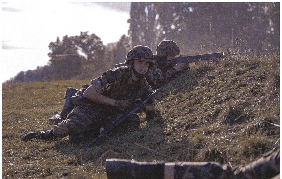
Wm bei der Befehlsgebung im Gefechtsschiessen.

Das ganze Bataillon wurde zusätzlich befohlen, den alten Standort zu verlassen und eine neue BPL zu erkunden und zu beziehen. Während der Übung wurde mir bewusst, dass wir in einem Einsatz Schwierigkeiten bezüglich der Beobachtungsmittel haben könnten. Mit dem Feldstecher, dem RLV 19 und dem WBG 90 hatten wir