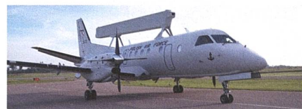
Polen erhält die erste Saab 340 Airborne Early Warning (AEW).

Saab hat im Rahmen einer Zeremonie in Linköping das erste von zwei Saab 340 Airborne Early Warning (AEW) Flugzeugen an Polen übergeben. Die Lieferung folgte nur zwei Monate, nachdem Polen zwei AEW-Flugzeuge in Auftrag gegeben hatte, da es sich um gerade verfügbare gebrauchte Flugzeuge aus den Vereinigten Arabischen Emiraten handelt. Die Saab