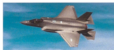
Zusätzliche F-35A für die Südkoreanische Luftwaffe.