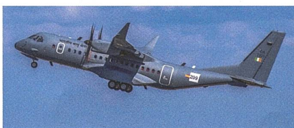
Erstes Transportflugzeug C295 der Indischen Luftwaffe ausgeliefert.

Airbus Defence and Space hat die Auslieferung des ersten C295 Transporters an Indien bekannt gegeben. Der mittelschwere Militärtransporter wurde im Werk Sevilla an die indischen Luftstreitkräfte übergeben. Indien hat 56 C295 bestellt und wird damit ihre alten Avro-748 Transportflugzeuge ersetzen. Die ersten sechzehn C295 werden im Airbus Werk Sevilla