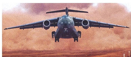
Österreich beschafft Transportflugzeuge des Typs C-390.

Wie die österreichische Verteidigungsministerin Klaudia Tanner anlässlich einer Pressekonferenz im September bekannt gegeben hat, wird sich Österreich bei der Nachfolge der C-130 «auf die Embraer C-390 zu fokussieren». Nach «Prüfung aller Optionen erfüllt die Embraer C-390 als einziges Flugzeug in der 20 t-Klasse alle Anforderungen des Bundesheers (Leistung, Geschwindigkeit, Sitzplätze, Zuladung, Avionikausstattung, Transport