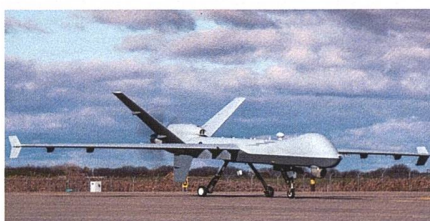
Zusätzliche Drohnen MQ-9A Reaper für die Niederlande.

Die Königlich Niederländischen Luftstreitkräfte (RNLAf) werden die Anzahl der von ihnen bestellten MQ-9A verdoppeln und damit den Gesamtauftrag von vier auf acht Flugzeuge erhöhen. Die Anzahl der MQ-9A Reaper werde verdoppelt, um die Kapazitäten im Bereich der Nachrichtengewinnung, Aufklärung und Überwachung zu Wasser und zu Lande zu