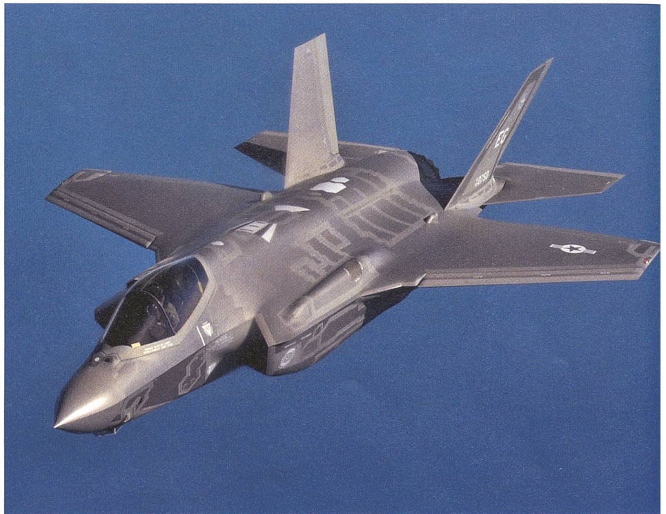
Die Bundeswehr wartet auf die bestellten F 35.

Strukturell und ausrüstungstechnisch hat die Bundeswehr im Augenblick zwei zentrale Probleme: Erstens, die Bundeswehr verfügt über zu wenig Gerät und dieses ist teilweise veraltet. Beispielsweise haben die Panzerbataillone maximal 70