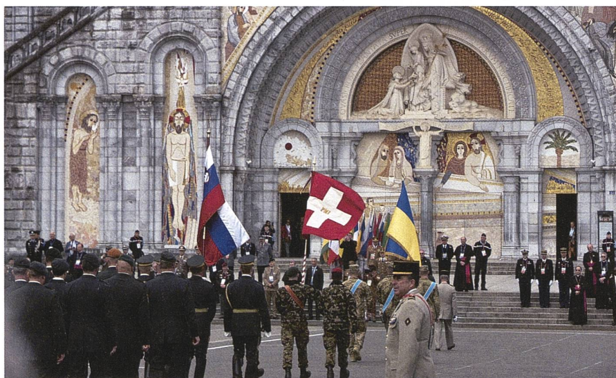
Armeeangehörige aus der ganzen Welt pilgern jedes Jahr nach Lourdes, um gemeinsam für den Frieden zu beten.

Am Samstagnachmittag fanden auf den Plätzen und Strassen der Stadt die Konzerte von 15 Militärmusiken aus der ganzen Welt statt. Dem Schweizer Militärspiel war diesmal eine besondere Ehre zugezählt. Unsere kleine, aber feine Musik durfte in einem Pavillon vor dem Stadthaus aufspielen. Der Bürgermeister von Lourdes persönlich war für die Begrüssung gekommen.