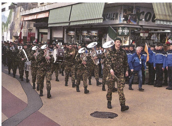
Das Schweizer Militärspiel durfte in einem Pavillon vor dem Stadthaus in Lourdes spielen.