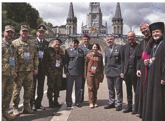
Die ukrainische Vize-Verteidigungsministerin bedankte sich für die humanitäre Hilfe der Schweiz.

Die Schweizer Delegationsleitung erhielt anschliessend eine Führung im Rathaus, inklusive einen Eintrag durch Div Guy Vallat im Goldenen Buch von Lourdes. Dies mit der feinen Bemerkung des Stadtpräsidenten, dass nur wenige Wochen vorher kein geringerer als der französische Präsident Macron auf dem gleichen Stuhl sass und sich in diesem Buch «verewigte»