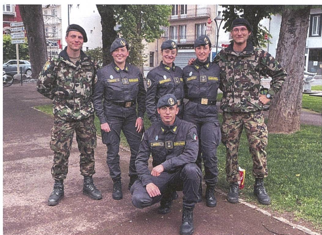
Internationale Begegnungen machen die Militärwallfahrt so besonders.