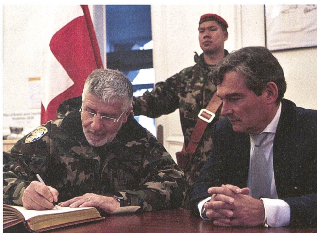
Eine besondere Ehre: Der Eintrag in das Goldene Buch von Lourdes.