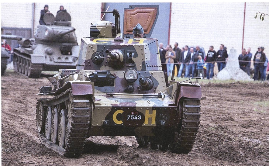
Der Schweizer Panzerwagen 39 «Praga» auf dem Museumsgelände.