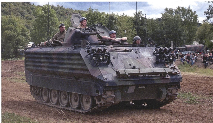
Schützenpanzer M113 bei der Rundfahrt.