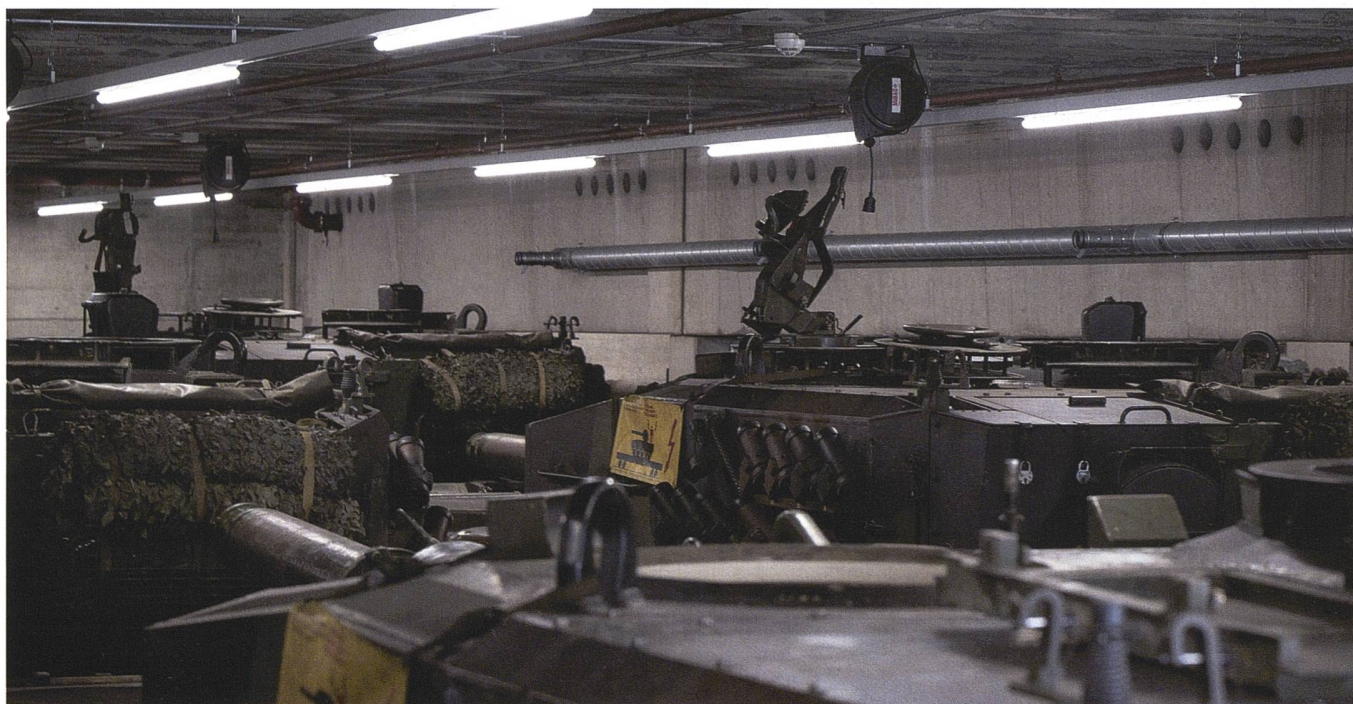
Die Armee benötige laut Bundesrätin Amherd die stillgelegten Panzer Leopard 2 nicht mehr.