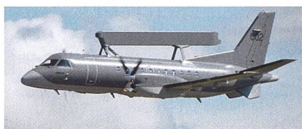
Frühwarnflugzeug Saab 340 für Polen.

Das polnische Verteidigungsministerium hat zwei Saab 340 Frühwarnflugzeuge bestellt. Laut Saab entspricht der neue Auftrag einem Wert von 600 Millionen Kronen, der Vertrag soll in den Jahren 2023 bis 2025 abgewickelt werden. Polen kauft dabei zwei Saab 340 Turbopropellerflug-