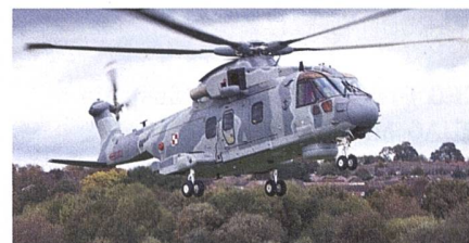
U-Boot-Bekämpfungs- und SAR-Hubschrauber AW101.

Die Auslieferungen der vier Leonardo AW101 an Polen hat begonnen. Die Hubschrauber sind für die U-Boot-Bekämpfung und SAR-Dienste als Ersatz der Mi-14 vorgesehen. Der Vertrag wurde im April 2019 mit der Wytwórnia Sprzętu Komunikacyjnego «PZL-Świdnik» SA (Tochtergesellschaft von Leonardo in Polen) geschlossen, die für Lieferung sowie ein Logistik- und Ausbildungspaket zuständig ist. Der Vertragswert beträgt 373 Mio. Euro, die Auslieferungstermine der Hubschrauber waren ursprünglich ab Ende