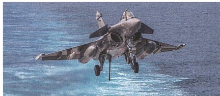
Rafale M neues Trägerflugzeug.

Nachdem die indische Luftwaffe bereits 36 Rafale-Kampffjets im Einsatz hat, setzt auch die indische Marine neu auf den französischen Fighter. Indien hat für ihre See-streitkräfte bei dem französischen Flug-