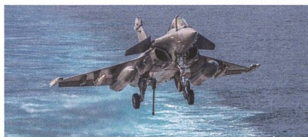
Rafale M neues Trägerflugzeug.

Nachdem die indische Luftwaffe bereits 36 Rafale-Kampffjets im Einsatz hat, setzt auch die indische Marine neu auf den französischen Fighter. Indien hat für ihre See-streitkräfte bei dem französischen Flug-