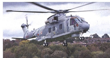
U-Boot-Bekämpfungs- und SAR-Hubschrauber AW101.

Die Auslieferungen der vier Leonardo AW101 an Polen hat begonnen. Die Hubschrauber sind für die U-Boot-Bekämpfung und SAR-Dienste als Ersatz der Mi-14 vorgesehen. Der Vertrag wurde im April 2019 mit der Wytwórnia Sprzętu Komunikacyjnego «PZL-Świdnik» SA (Tochtergesellschaft von Leonardo in Polen) geschlossen, die für Lieferung sowie ein Logistik- und Ausbildungspaket zuständig ist. Der Vertragswert beträgt 373 Mio. Euro, die Auslieferungstermine der Hubschrauber waren ursprünglich ab Ende