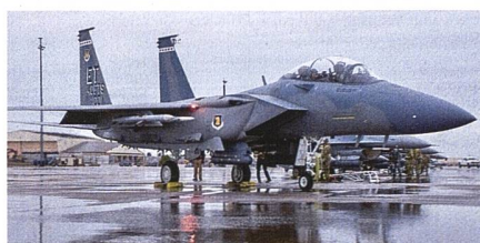
Indonesien will F-15EX beschaffen.

Indonesien hat mit Boeing eine Kaufabsichtserklärung über vierundzwanzig F-15EX Eagle unterzeichnet, die US-Regierung muss das Geschäft noch bewilligen. Für Boeing wäre es ein wichtiges Geschäft für die F-15 Eagle, diese wird seit fünfzig Jahren im ehemaligen McDonnell Douglas Werk St. Louis gebaut. Es wird davon ausgegangen, dass die Vereinigten Staaten von Amerika den Deal durchwinken werden, die US Defense Cooperation Security Agency hat bereits im Februar 2022 einem möglichen Foreign Military Sales