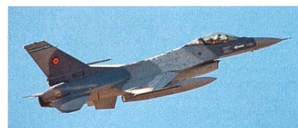
Rumänische F-16 sollen durch F-35 ergänzt werden.