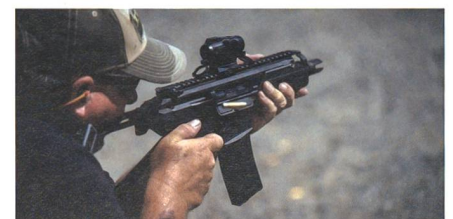
SIG McX Rattler für die Spezialkräfte.