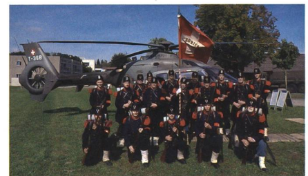
«Science-Fiction» aus 1861er-Perspektive: Gruppenbild zur Erinnerung an den TdA vom 3. September 2022.