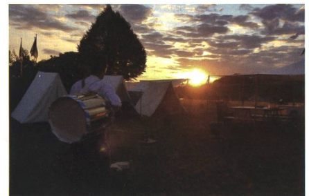
Tagwache im Feldlagerfeuer.

Alle vier Jahre feiert Heiden ein Biedermeierfest. Zum vierten Mal errichtete die Cp 1861 gemeinsam mit der Maritz-Batterie und der Geb Art Btr 26 ein historisches Feldlager. Viele interessierte Besucher tauchten ein in die Ära von General Dufour und liessen sich an den Geschützen, am Schiessstand, bei der Habersackvisite, am Lagerfeuer militärische Details erklären.