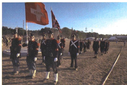
Die Cp 1861 wirkte heuer auch am Convoy to Remember in Birnenstorf mit.

In alten Zeiten schwelgen konnten die Kameradinnen und Kameraden der Cp 1861 im Rahmen des Convoy to Remember. In Birnenstorf eröffneten die Luftwaffe und die Salutschüsse der 1861er die Militärödtimer-Show.