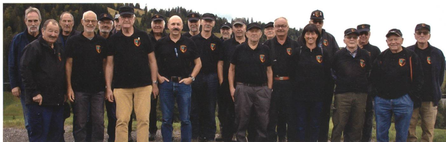
Gruppenbild der Teilnehmenden am Veteranenwettkampf, Sektion UOV Veteranen Amt Erlach.

Nach einem stärkenden Kaffee und Sandwiches ging es zum ersten Posten, bei welchem die Flugzeugkenntnisse, auch von Modellen aus früheren Zeiten, getestet wurden. Weiter gehörten das Distanzschätzen und das Festlegen des Gewichtes eines bestimmten Steins zu den Aufgaben. Da wir als Berner Seeländer mehr die Distanzen in der Ebene gewohnt sind, bekun-