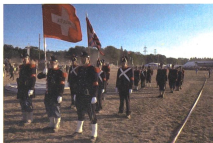
Die Cp 1861 wirkte heuer auch am Convoy to Remember in Birnenstorf mit.

In alten Zeiten schwelgen konnten die Kameradinnen und Kameraden der Cp 1861 im Rahmen des Convoy to Remember. In Birnenstorf eröffneten die Luftwaffe und die Salutschüsse der 1861er die Militäröldtimer-Show.