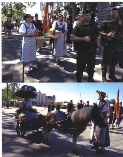
Die Bundesfeier der Stadt Zürich ist aus der Agenda der Cp 1861 kaum mehr wegzudenken.

Seit knapp einem Jahr sind die Mitglieder der Cp 1861 also wieder voll dabei und haben in den vergangenen Monaten entsprechend viele Einsätze absolvieren dürfen. Dazu gehörte unter anderem die Bundesfeier in Zürich. Es ist die grösste Bundesfeier der Schweiz und seit über 20 Jahren ist die Cp 1861 fester Bestandteil der Festivitäten. Mit einer Salve aus den Vorderladern werden jeweils der Umzug und die Feier auf der Stadthausanlage eröffnet. Die Trachtenfrauen und die Ponykutsche gehören genauso zum Umzug wie der Fahnenzug.