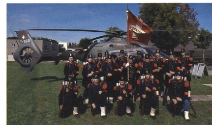
«Science-Fiction» aus 1861er-Perspektive: Gruppenbild zur Erinnerung an den TdA vom 3. September 2022.