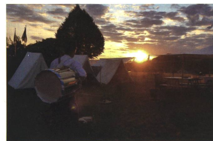
Tagwache im Feldlagerfeuer.

Alle vier Jahre feiert Heiden ein Biedermeierfest. Zum vierten Mal errichtete die Cp 1861 gemeinsam mit der Maritz-Batterie und der Geb Art Btr 26 ein historisches Feldlager. Viele interessierte Besucher tauchten ein in die Ära von General Dufour und liessen sich an den Geschützen, am Schiessstand, bei der Habersackvisite, am Lagerfeuer militärische Details erklären.