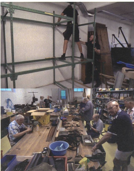
Die Mitglieder der Cp 1861 haben die anlassfreie Zeit während Corona genutzt, um das neue Zuhause in Bauma weiter voranzutreiben.

Auch während des Umzugs von Uster ins Tösstal war die Compagnie 1861 voll funktionsfähig: Die Infrastruktur im alten Zeughaus blieb in Betrieb, bis am neuen Standort die neuen Lagerräume für Uniformen, Waffen und Ausrüstung aufgebaut waren und auch die behelfsmässige Garderobe zur Verfügung stand sowie die Werkstatt für den PD an den Waffen. In dieser Phase sorgte die Coronapandemie dafür, dass der Grossteil der geplanten Anlässe abgesagt werden musste und nur wenige Einsätze stattfanden. Die Mitglieder des UOV Uster nutzten die anlassfreie Zeit für den Aufbau des neuen Vereinszentrums und die Cp 1861 kehrte im November 2021 zurück zum Normalbetrieb mit dem Ustertag und den Vorbereitungen fürs Zürcher Sechseläuten.