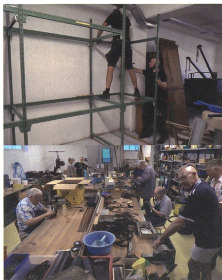
Die Mitglieder der Cp 1861 haben die anlassfreie Zeit während Corona genutzt, um das neue Zuhause in Bauma weiter voranzutreiben.

Auch während des Umzugs von Uster ins Tössstal war die Compagnie 1861 voll funktionsfähig: Die Infrastruktur im alten Zeughaus blieb in Betrieb, bis am neuen Standort die neuen Lagerräume für Uniformen, Waffen und Ausrüstung aufgebaut waren und auch die behelfsmässige Garderobe zur Verfügung stand sowie die Werkstatt für den PD an den Waffen. In dieser Phase sorgte die Coronapandemie dafür, dass der Grossteil der geplanten Anlässe abgesagt werden musste und nur wenige Einsätze stattfanden. Die Mitglieder des UOV Uster nutzten die anlassfreie Zeit für den Aufbau des neuen Vereinszentrums und die Cp 1861 kehrte im November 2021 zurück zum Normalbetrieb mit dem Ustertag und den Vorbereitungen fürs Zürcher Sechseläuten.