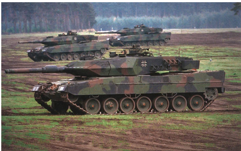
Die Ukraine bittet Deutschland um Kampfpanzer. Die Bundesregierung zögert. Ihr Argument: Die Ausbildung würde zu lange dauern.