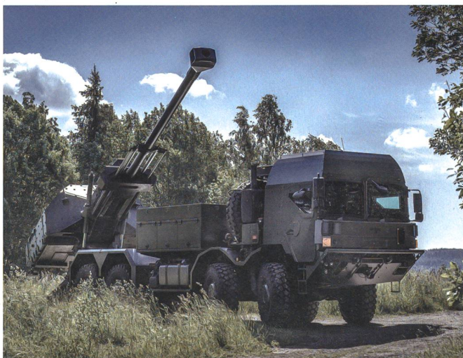
Die neuen Artilleriesysteme sollen radgestützt operieren. Hier im Bild: BAE Systems Bofors AB, Schweden, Archer 8x8 mobile howitzer.