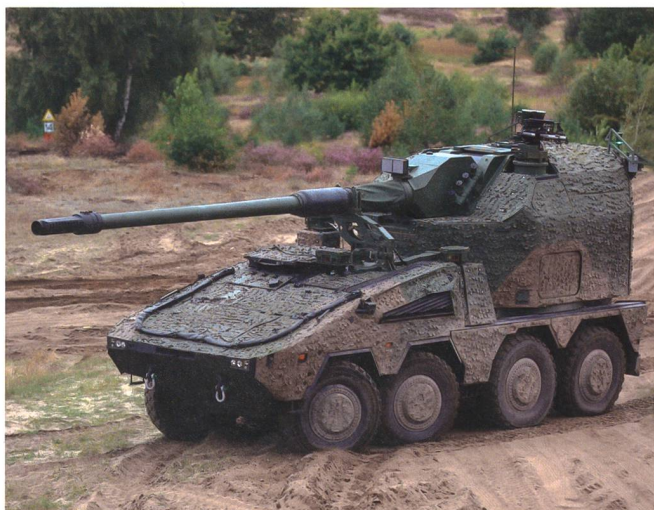
Die zweite Option: Krauss-Maffei Wegmann GmbH & Co. KG, Deutschland, RCH 155 AGM Artillery Gun. Abklärungen und Versuche sind für die Jahre 2023 und 2024 im In- und Ausland geplant.