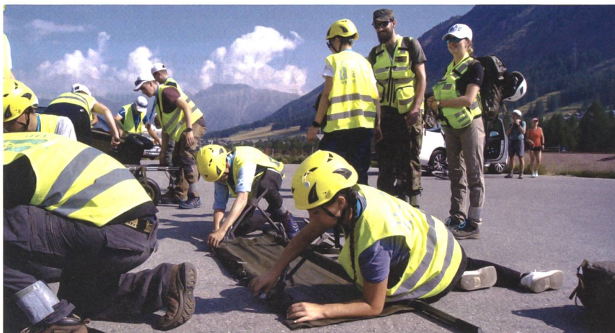
Dank Softwareupdates wird nun auch der Besuch des AULA im PISA-System eingetragen. Ideal also für die Vorbereitungen auf eine Funktion in der Sanitäts- oder Rettungstruppe.