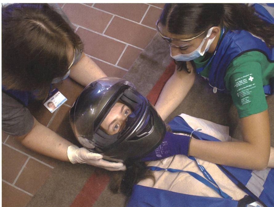
Jeder und jede kann helfen. Erste Hilfe hat keine Grenzen.