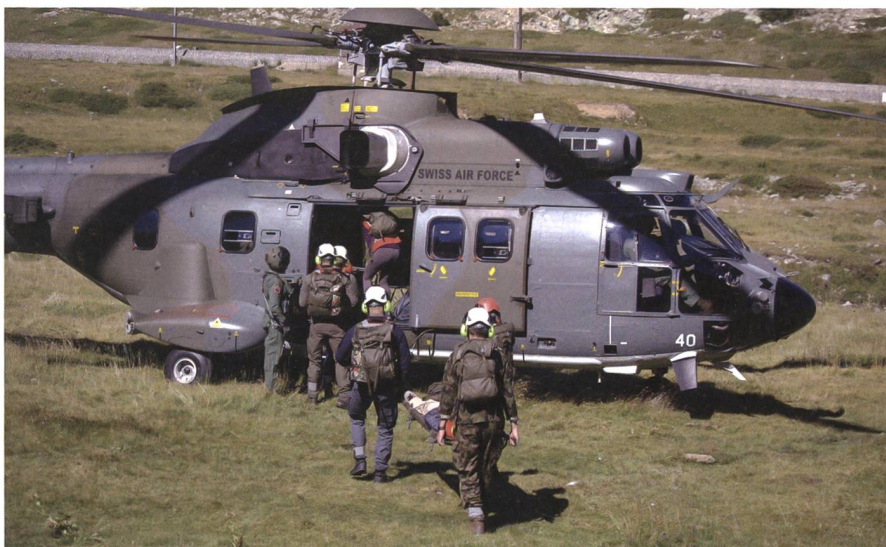
Die Teilnehmer der vierten Stufe lernen zu biwakieren und Patienten zu evakuieren.