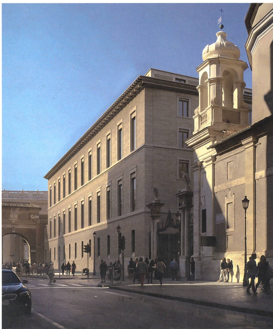
Illustration der neuen Kaserne. Luzern stellt die grösste kantonale Delegation an Gardisten. Der Solidaritätsfranken ist ein kleines Zeichen der Wertschätzung für 500 Jahre Verbundenheit mit der Schweizergarde.

Viele Schweizer Kantone beteiligen sich am Neubau der Kaserne der Schweizergarde. In Luzern würde das einen Franken pro Einwohner kosten. Gegen diesen Beitrag haben SP, Grüne und die Freidenker-Vereinigung das Referendum ergriffen. Darum findet am 25. September 2022 eine kantonale Volksabstimmung statt.