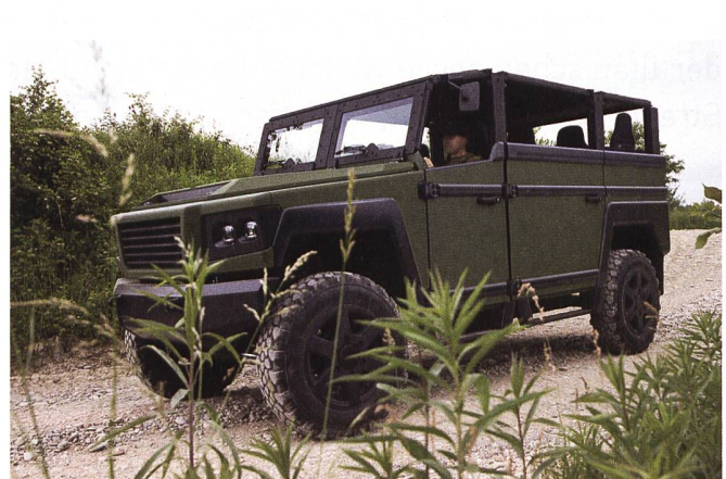
Ein möglicher Transporter für leichte Kräfte?