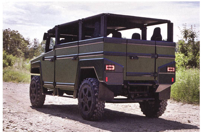
Das Fahrzeug kann in seiner Transport-Variante bis zu 10 Soldaten transportieren.