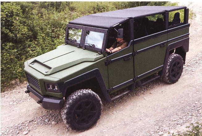
Neuer Zuwachs in der GDELS-Familie: Der MERLIN.