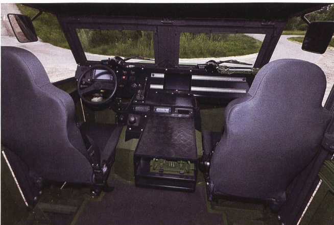
Ein Blick in die Kabine: Das Chassis basiert auf dem DURO und dem EAGLE.