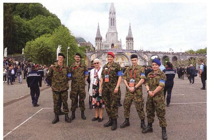
Ein Teil der Schweizer AdA waren im Ordnungs- und Sicherheitsdienst eingeteilt.