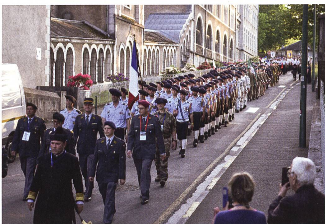
Die Schweizer Delegation führte den Marsch von rund 1000 Teilnehmern vom Zeltlager zur Basilika an.