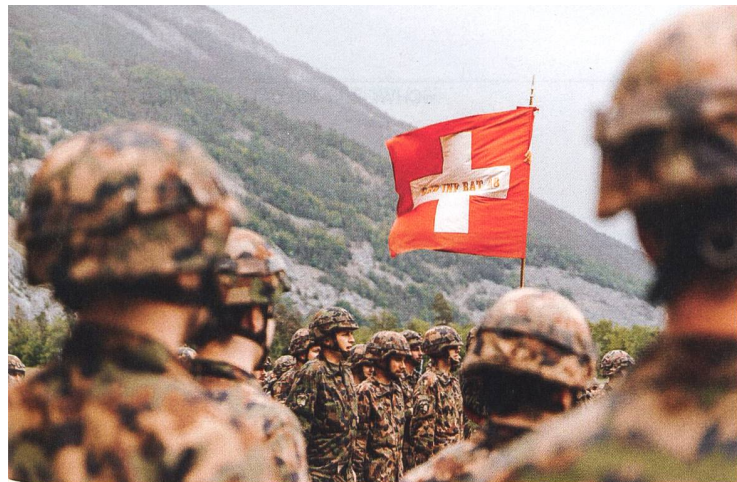
Dieses Jahr bildete das Geb Inf Bat 48 das militärische Hauptelement am Boden.