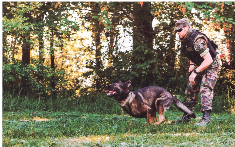
Das Geb Inf Bat 48 bereitete sich vorgängig auf den WEF Einsatz vor und profitiert dabei von der Verstärkung durch Militärpolizisten sowie Hundeführern.

In einem Punkt waren sich alle einig. Die Schweiz als Hort des Dialogs und internationalen Austauschs muss ihre Funktion als Konferenzstandort insbesondere auch in Zeiten der geopolitischen Konfrontation wahrnehmen können.