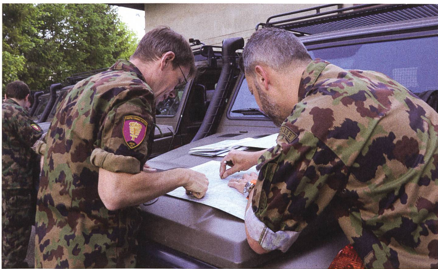
Vor der Fahrt: Die Route muss geplant werden. Navigationsgeräte sind nicht erlaubt.

Damit sind sie einer der grösseren, ausserdienstlichen Fachverbände der Schweiz. Sie erfüllen wichtige Aufgaben im vordienstlichen Bereich mit dem Jungmotorfahrer-Kurs.