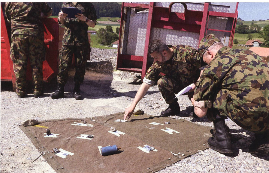
Unterwegs müssen auch Posten absolviert werden. Hier müssen die Fahrer einige Fahrzeugteile korrekt benennen.