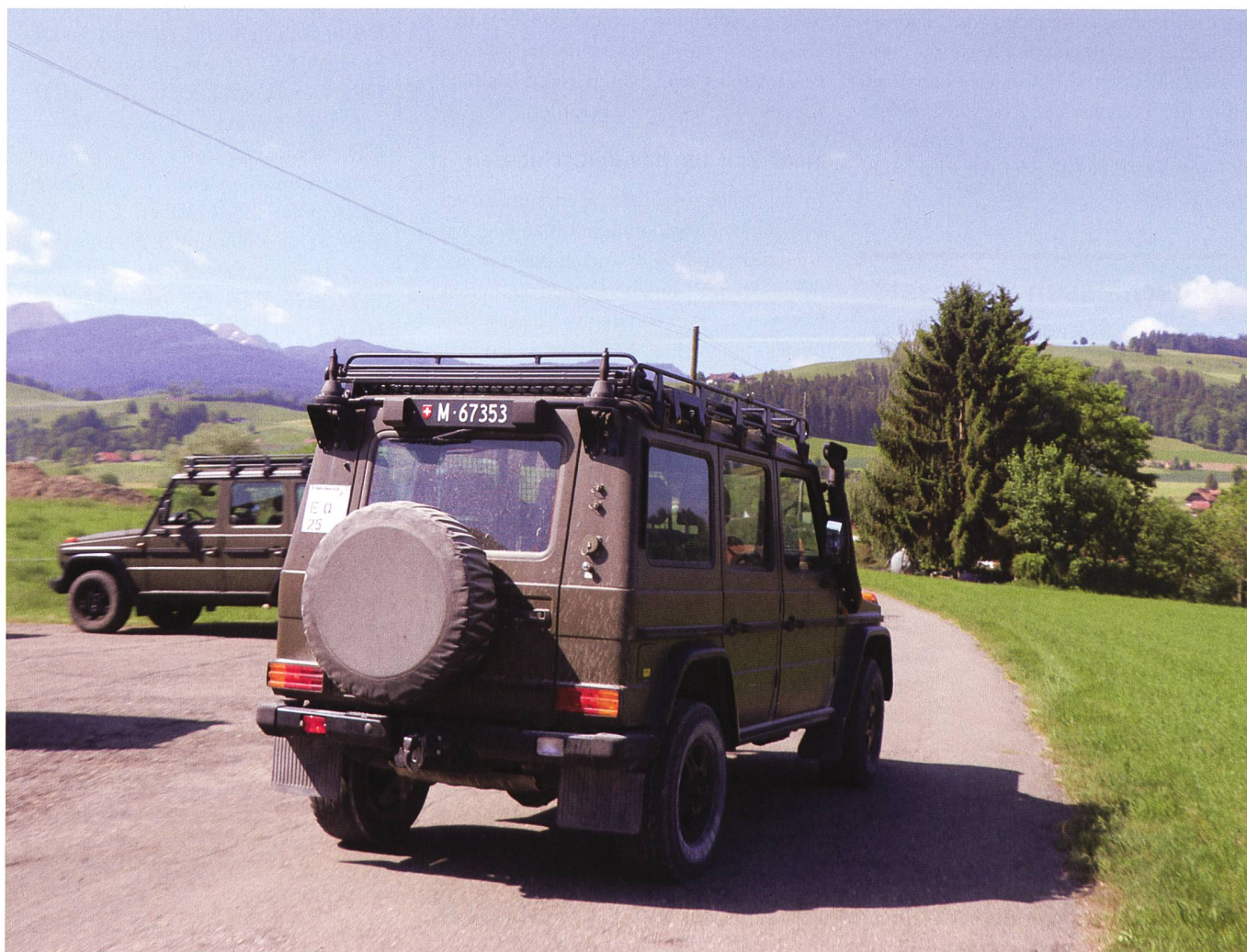
In einer Rally geht es darum, sich im Gelände zu orientieren und Wegpunkte zu suchen.

Die Motorfahrer der Armee können sich ausserdienstlich in einem der vielen regionalen Militär-Motorfahrer-Vereine betätigen. Insgesamt zählen alle Vereine zusammen rund 5500 Mitglieder.