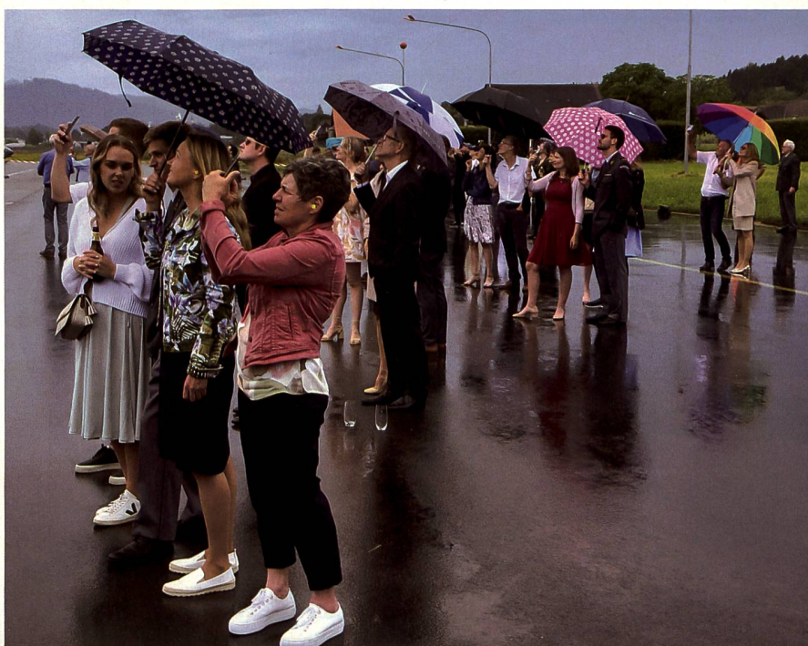
Die Familienangehörigen zeigten sich fasziniert vom Spektakel am Himmel.