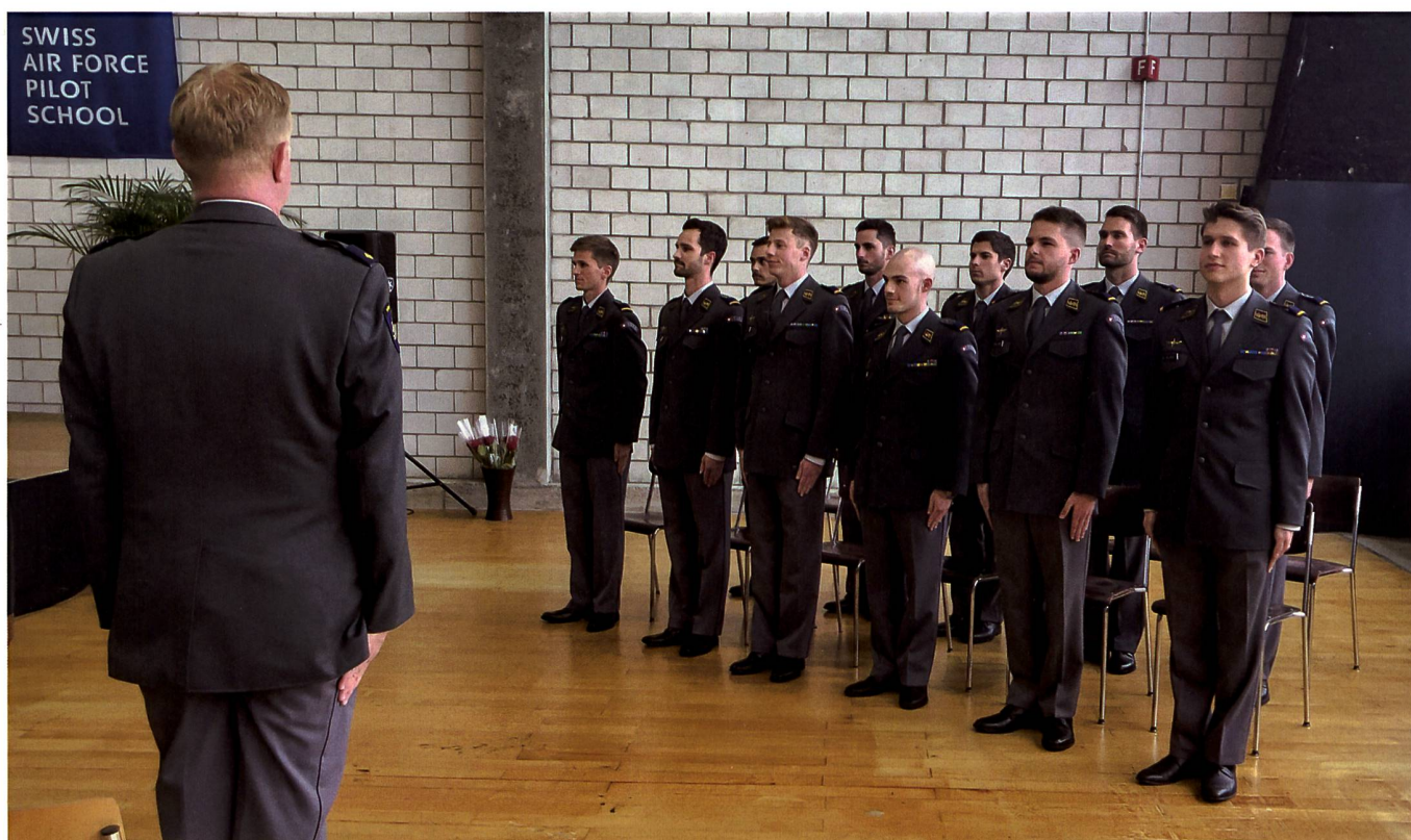
11 Piloten der Pilotenklasse 2015/2017 kurz vor der Brevetierung auf dem Militärflugplatz Emmen.

flut zu bewältigen, sie zu ordnen und gegebenenfalls Prioritäten zu setzen», führte Pfiffner weiter aus.