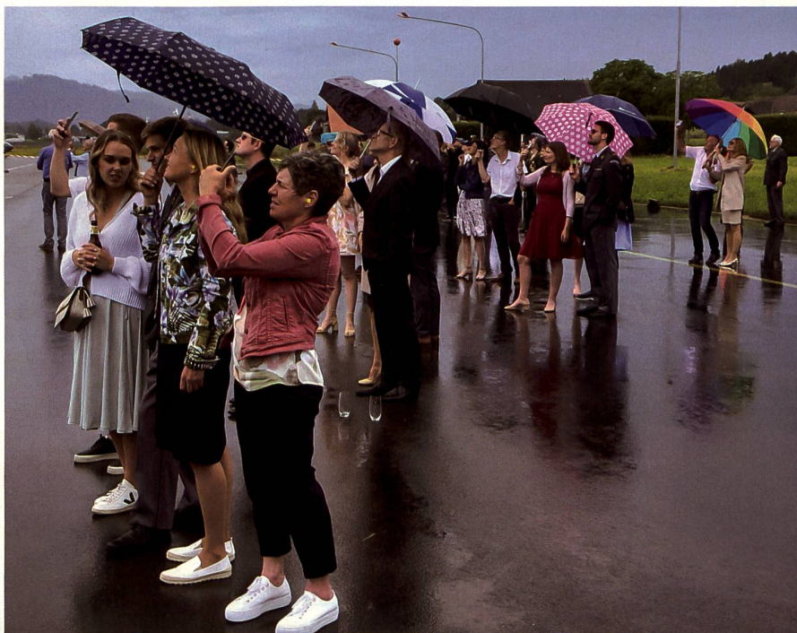
Die Familienangehörigen zeigten sich fasziniert vom Spektakel am Himmel.