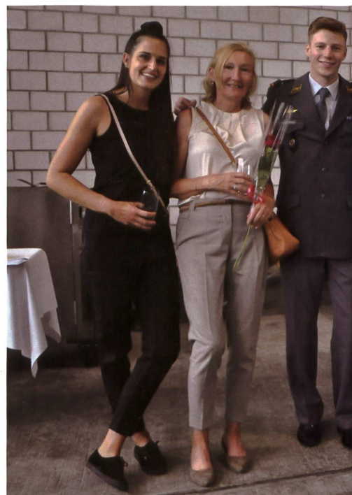
Stolzer brevetierter Militärpilot, «Battrick», mit