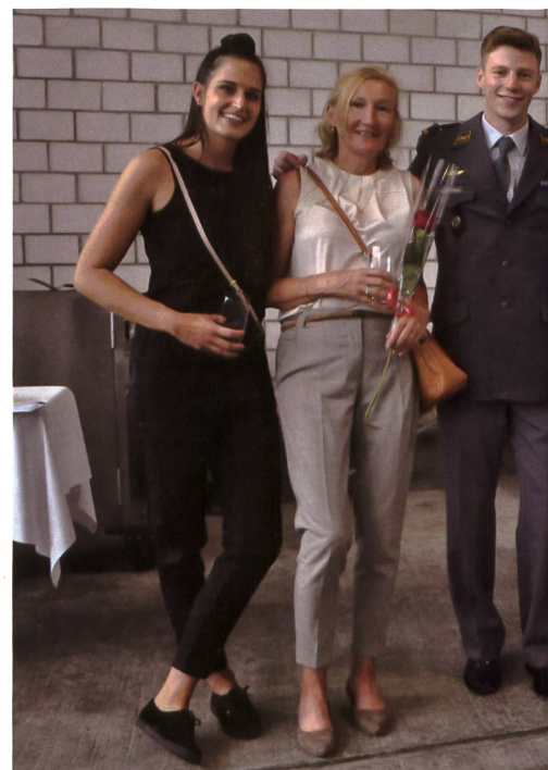
Stolzer brevetierter Militärpilot, «Battrick», mit