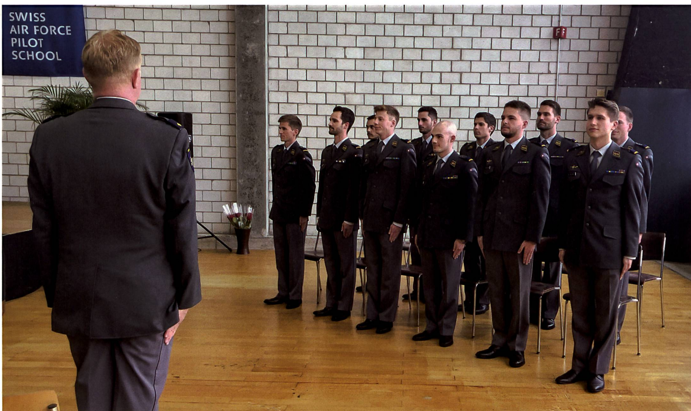
11 Piloten der Pilotenklasse 2015/2017 kurz vor der Brevetierung auf dem Militärflugplatz Emmen.

flut zu bewältigen, sie zu ordnen und gegebenenfalls Prioritäten zu setzen», führte Pfiffner weiter aus.