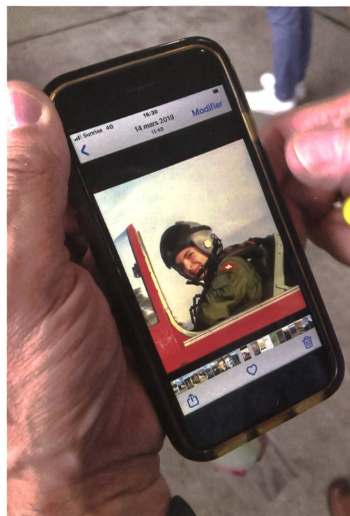
Da hat die Ausbildung gerade begonnen – ein Vater zeigt eines der ersten Bilder seines Sohnes im Cockpit.