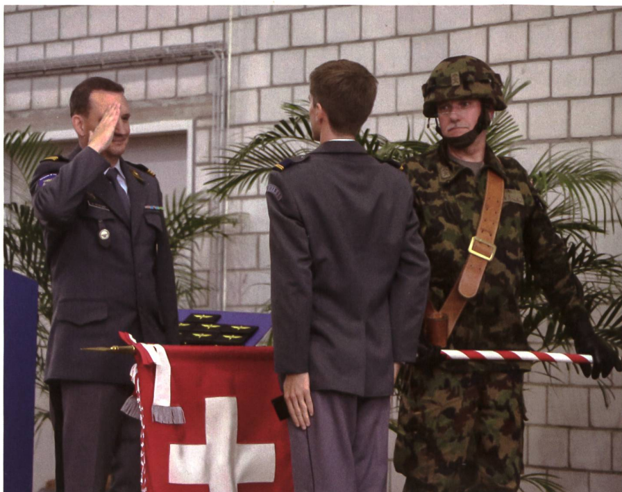
11 Männer wurden zugleich zum Militärpiloten und Oberleutnant befördert.

«Heute sind unsere Piloten verantwortlich dafür, eine grosse Informations-