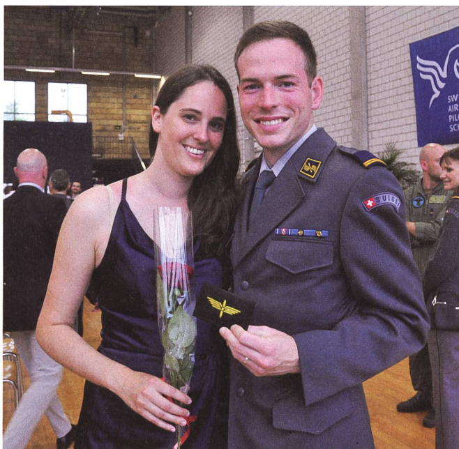
Militärpilot «Smoky» und seine Partnerin, Co-Pilotin bei EasyJet, sind nun ein Pilotenpaar.