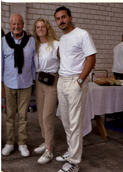
seiner Familie aus dem Kanton Waadt.

ren Bagatellen entstanden seien, meinte Pfiffner schmunzelnd. Zum Abschluss würdigte er die nun erworbene grosse «Portion» an Fähigkeiten als Bereicherung für die Luftwaffe und beendete seine