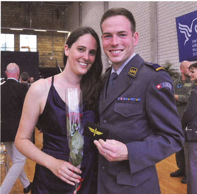
Militärpilot «Smoky» und seine Partnerin, Co-Pilotin bei EasyJet, sind nun ein Pilotenpaar.