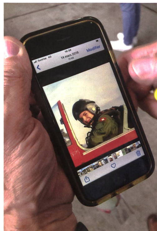
Da hat die Ausbildung gerade begonnen – ein Vater zeigt eines der ersten Bilder seines Sohnes im Cockpit.