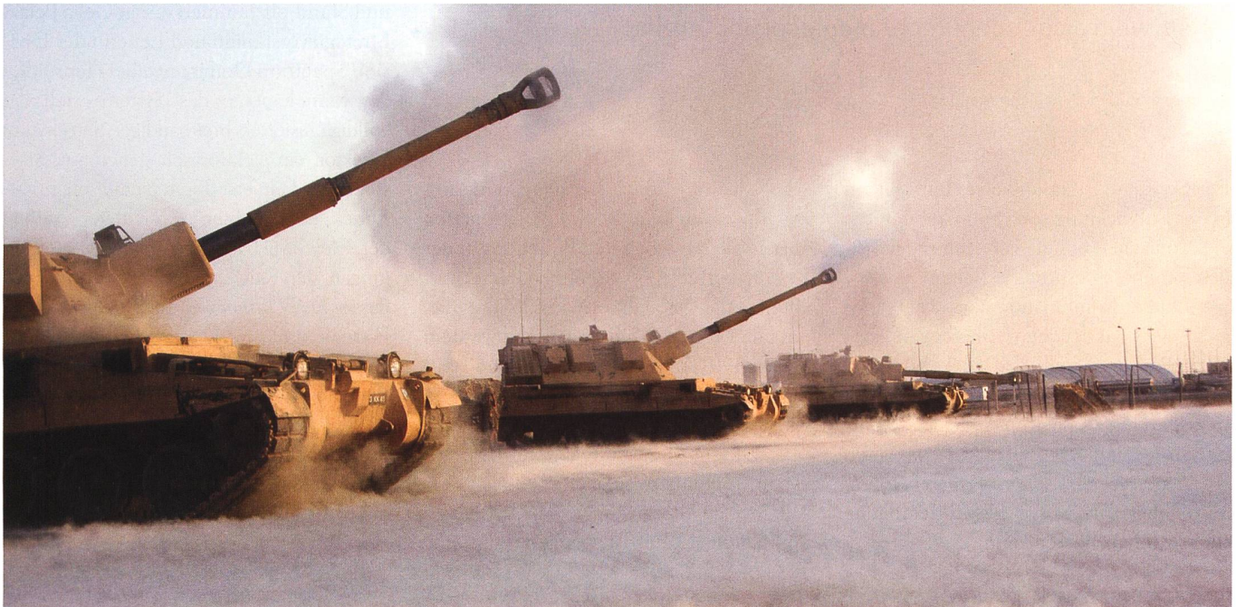
Eher am Ende der Nutzdauer – die AS-90-Panzerhaubitze. Hier im Bild in einem Feuerkampf im Irak, 2008.