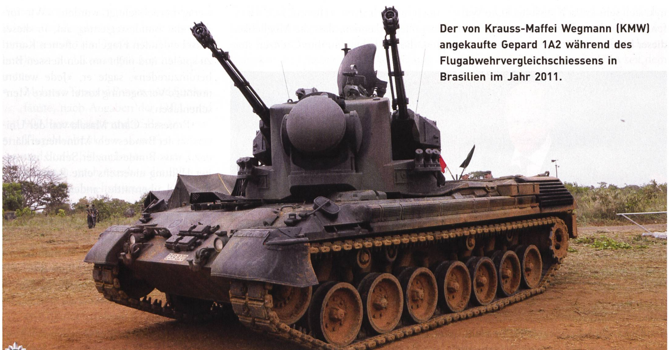
Der von Krauss-Maffei Wegmann (KMW) angekaufte Gepard 1A2 während des Flugabwehrvergleichsschiessens in Brasilien im Jahr 2011.

Es zeigt sich auch hier wieder, vor was Sicherheitsexperten seit Jahrzehnten warnen. Wenn die Gefahr da ist, bleibt keine Zeit mehr für Rüstungsgeschäfte. Daher soll man sich auch im Frieden für den Krieg rüsten und nicht umgekehrt. ✚