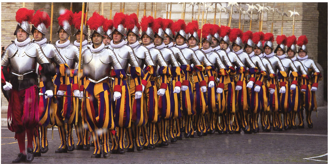
Seit dem Ende des 19. Jahrhunderts ist die Päpstliche Schweizergarde in einer Kaserne untergebracht, die aus drei Gebäuden besteht und an den Apostolischen Palast angebaut ist.