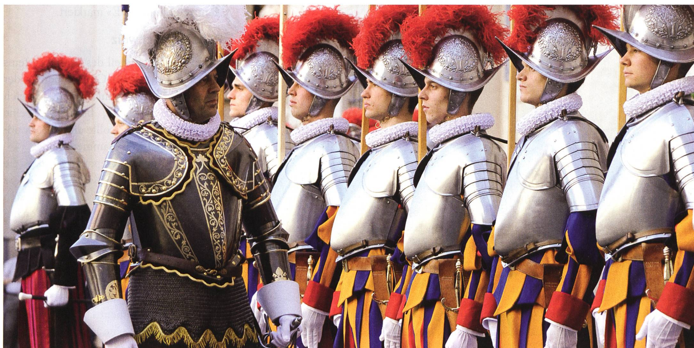
Der Luzerner Gardekommandant der Päpstliche Schweizergarde im Vatikan, Oberst Christoph Graf.

Die Zahl der Gardisten, heute 135 Soldaten und Offiziere, wurde kürzlich dank des Willens des Heiligen Vaters erhöht.