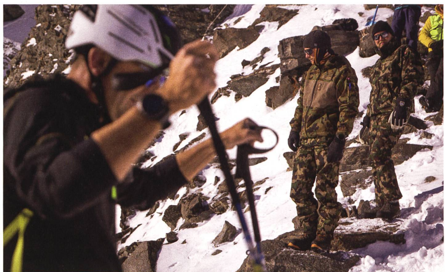
Die PdG wird massgeblich von der Schweizer Armee mitorganisiert und unterstützt.