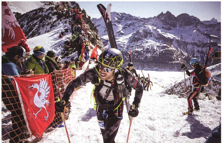
57,5 Kilometer und 4386 Höhenmeter stehen zwischen Start und Ziel der Patrouille des Glaciers.