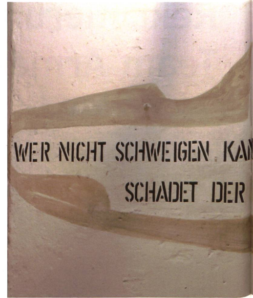
Früher ein gut gehütetes Geheimniss- heute ein Die Festung Rein kann nun auch durch Gruppen