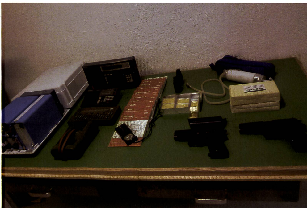
Material einer Widerstandsgruppe. Darunter befinden sich unter anderem: Chiffriergerät «Phönix» sowie Waffen, Karten und die legendären Goldplättchen. Das Gold wurde als Finanzspritze für die Widerstandsorganisation beschafft.