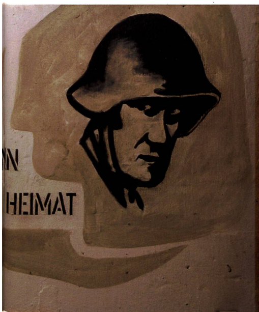
Zeuge des Schweizer Wehrwillens. Besucht werden.