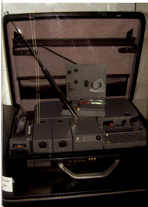
Das Funkgerät «Harpoon» – ein Gerät für Kommando-Organisationen.

Mit einer Führung durch die Anlage kann auch das komfortabel eingerichtete Auditorium für Präsentationen, Events oder Apéros gebucht werden. +