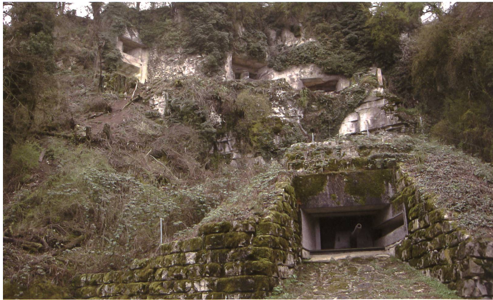
Die Festung Rein, an der Ostflanke des Reinerbergs bei Brugg gelegen, hat eine spannende Vergangenheit.