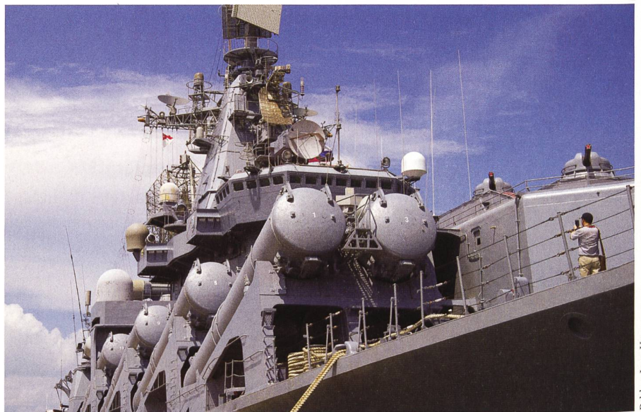
Der nicht mehr neueste, aber kampfstärke und imposante Kreuzer RFS «Varyag», Flaggschiff der russischen Pazifikflotte, kreuzt jetzt im östlichen Mittelmeer und dürfte vor allem zur Beschattung der US-Träger-Kampfgruppe USS «Harry S. Truman» dienen. Die Hauptbewaffnung sind die SS-N-12 «Sandbox» Schiff-Schiff Lenkwaffen.

Gegenwärtig kreuzen 21 russische Kriegsschiffe, darunter 12 Kampfschiffe und die erwähnten 10 amphibischen Landungsschiffe, im Schwarzen Meer, darunter der Kreuzer «Moskva» («Slava»-Klasse). Russische Marineverbände haben Mariupol und Kherson, aber auch Vororte von Odessa (16.3.) aus dem Schwarzen Meer und dem Asow'schen Meer mit Bordartillerie beschossen. Uboote der «Kilo»-Klasse haben am 20.3. im Westen der Ukraine Lviv (das ehemalige Lemberg) und am 4.4.22 Odessa mit Marschflugkörpern beschossen.