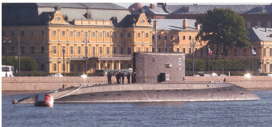
Russische Uboote der konventionellen «Kilo»-Klasse sind modern und leistungsfähig. Hier die RFS «Dimitrov». Boote mit 3000 Tonnen Verdrängung (getaucht) sind derzeit auch in Kampfhandlungen mit der Ukraine im Schwarzen Meer und im Mittelmeer involviert.

Die «Admiral Grigorovich», eine Fregatte der «Krivak-IV»-Klasse, soll aus der Region von Sevastopol acht SS-N-30 Kalibr Raketen gegen Mariupol abgefeuert haben.