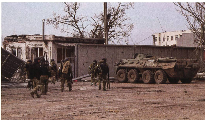
Russland führt das Gefecht streng hierarchisch. Der Verbund der Teilstreitkräfte funktioniert scheinbar nicht.

Funknetze der russischen Streitkräfte werden aufgeklärt. Dann erfolgen Überfäll-