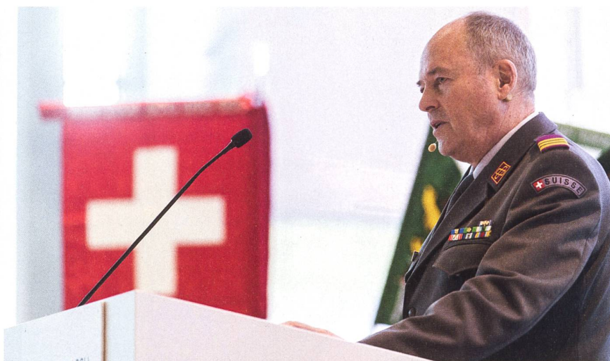
Oberst Knill: «Ohne Korrekturen muss bis 2030 damit gerechnet werden, dass das Erfolgsmodell Milizarmee ernsthaft in Frage gestellt ist.»