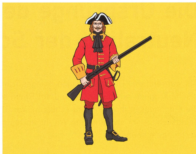
Das Wappen des Distrikts Lefortovo.

Er war überzeugter Raucher und nicht abgeneigt, dem Bacchus tüchtig zu huldigen.