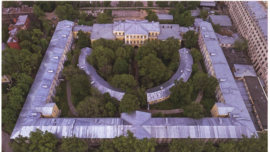
In seiner späten Zeit in Moskau lebte Lefort in einem Palast, der ihm von seinem Kaiser geschenkt worden war. Eine grosse Ehre, in einer Zeit, in der die meisten Bauten aus Holz erbaut wurden.

Daneben beteiligte er sich am Gericht über die Strelitzen und fand noch Zeit, um diplomatische Verhandlungen mit den ausländischen Gesandten zu führen und