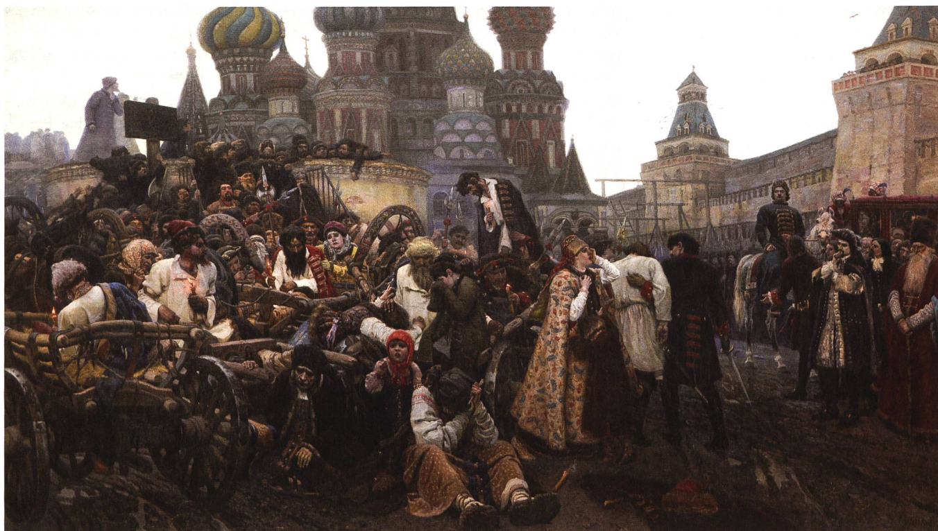
Der Aufstand der Strelizen im Juni 1698 unterbrach die diplomatische Mission im Ausland. Der Aufstand wurde brutal niedergeschlagen.

Das nächste Ziel der 200-köpfigen russischen Mission hiess Wien. Peter und Lefort, die inzwischen erfahren hatten,