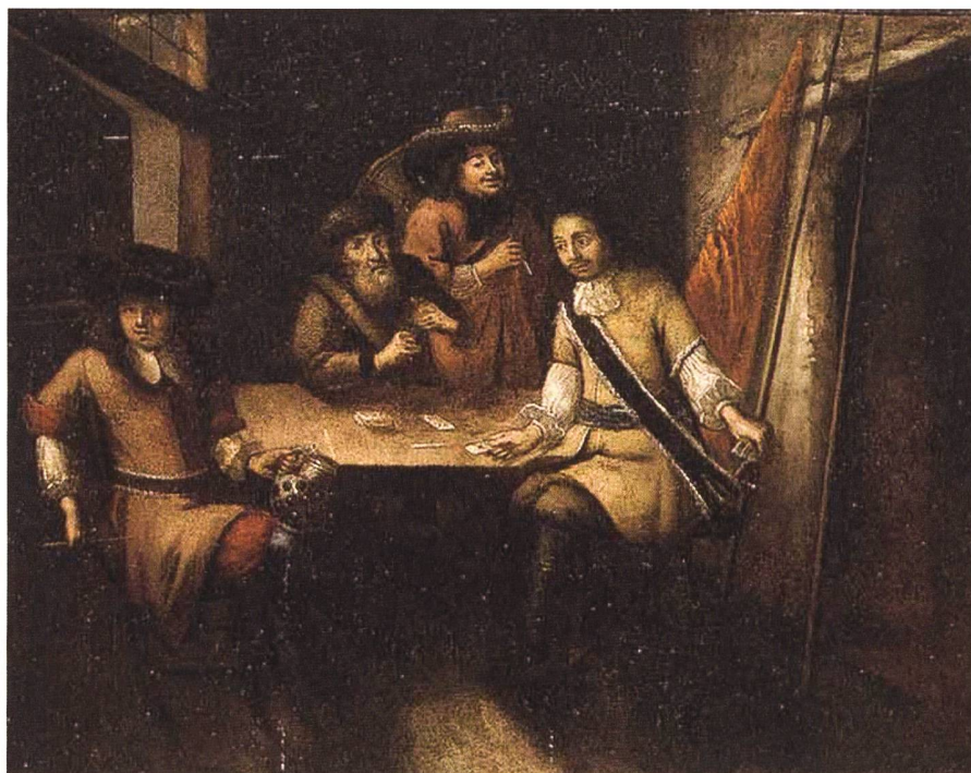
Die «Grosse Gesandtschaft» in den Niederlanden. Zar Peter wollte so volksnah wie möglich auftreten und Lefort unterstützte ihn als sein «Ersten Ambassadeur».

Als Belohnung für seine Verdienste wurde Lefort zum Vizekönig von Nowgorod ernannt und erhielt, neben zahlreichen Wertgegenständen, einige Dörfer mit je 200 Bauern geschenkt.