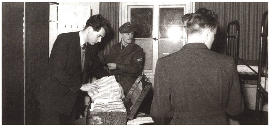
Der Spind wird bezogen. Das neue Konzept lautete nun: «Staatsbürger in Uniform».

Durch die Konzeption der Inneren Führung und dem damit verbundenen Leitbild des Staatsbürgers in Uniform wur-