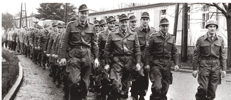
Bundeswehrsoldaten der ersten Generationen beim Formaldienst. In der Konzeption der Armee wurde besonderer Wert darauf gelegt, dass ein Recht und eine Pflicht zum Ungehorsam im Falle verbrecherischer Befehle fixiert werden sollte.

Ein zentrales Problem der Planer einer neuen Armee für die Bundesrepublik war das Selbstverständnis der Bundeswehr und ihre Rolle im Staate.