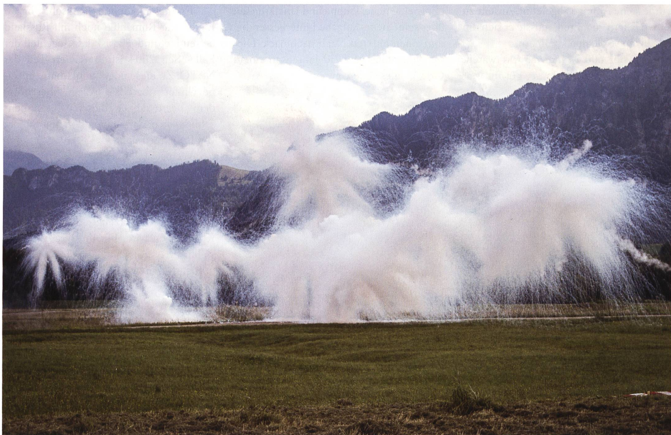
Die Nebelgranate verdeckt nicht nur die Sicht des Gegners. Sie stört auch Infrarot-Zielsysteme oder Waffen, die mit einem Laser in das Ziel gelenkt werden.

Die Nebelpatrone 21 ist für den Verschuss aus Nebelmittelwurfanlagen auf taktischen Fahrzeugen vorgesehen und dient dem Schutz der Soldaten.