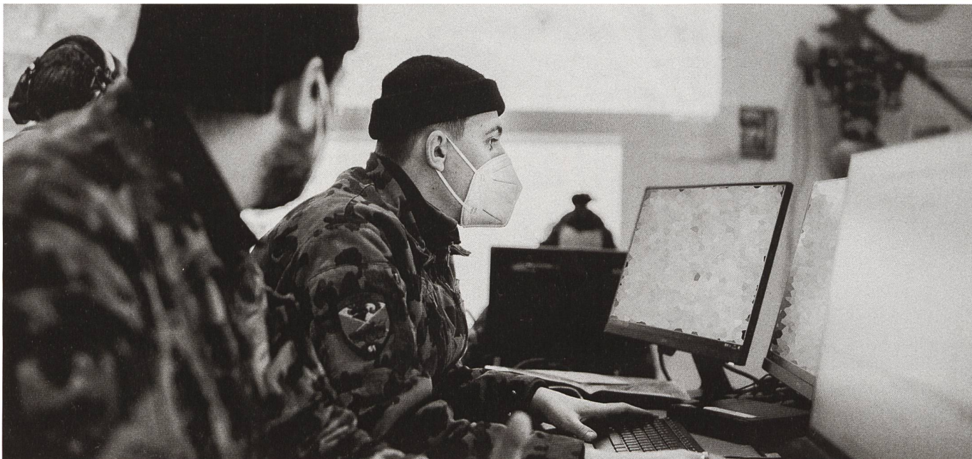
Im Hintergrund eine Hellebarde. Im Vordergrund: Soldaten bedienen das Führungsinformationssystem Heer.