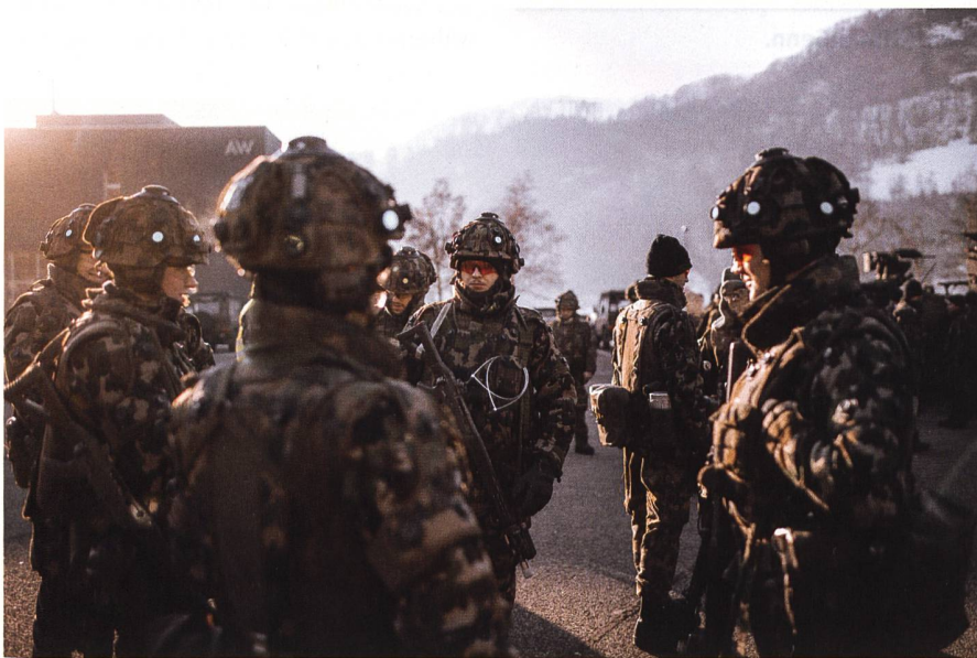
Das Inf Bat 61 absolvierte dieses Jahr seinen WK im Januar 2022 unter schwierigen Bedingungen.