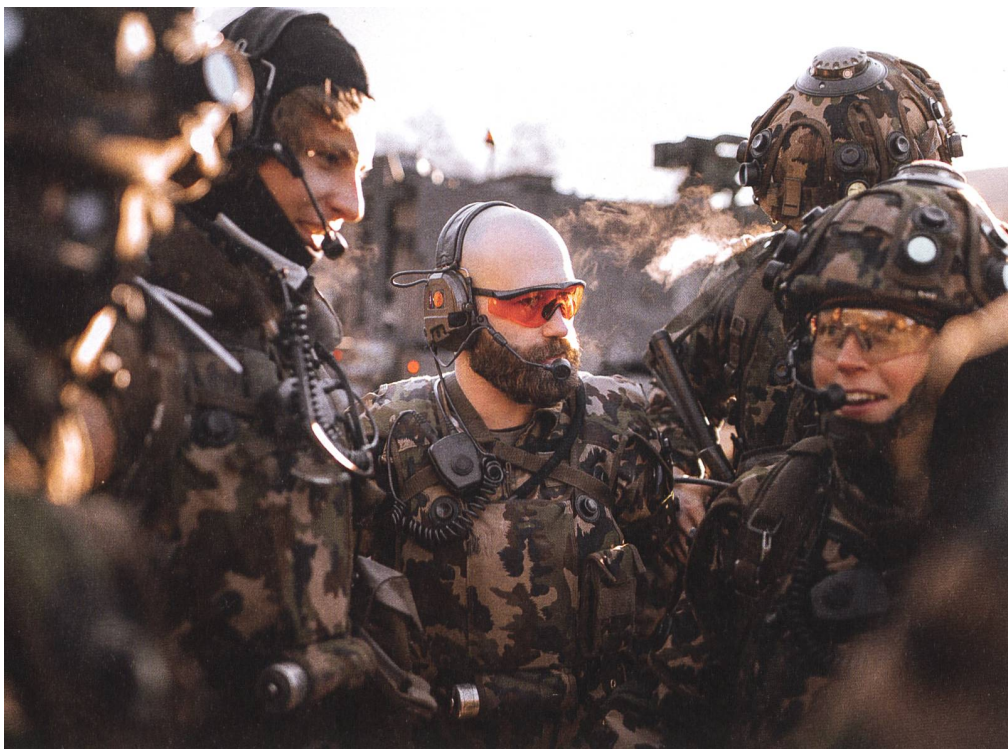
Dieses Jahr konnte das Bataillon seine Fähigkeiten im GAZ OST unter Beweis stellen.