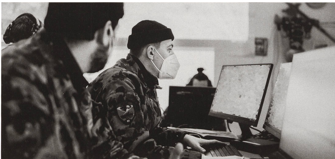
Im Hintergrund eine Hellebarde. Im Vordergrund: Soldaten bedienen das Führungsinformationssystem Heer.

Obwohl die Soldaten des Inf Bat 61 während des WK keine Minute im Aus-