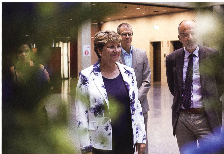
Hinter dem Rücken von Bundesrätin Amherd sollen weitere Departemente ihre eigenen Verhandlungen geführt haben.