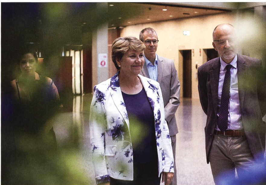
Hinter dem Rücken von Bundesrätin Amherd sollen weitere Departemente ihre eigenen Verhandlungen geführt haben.