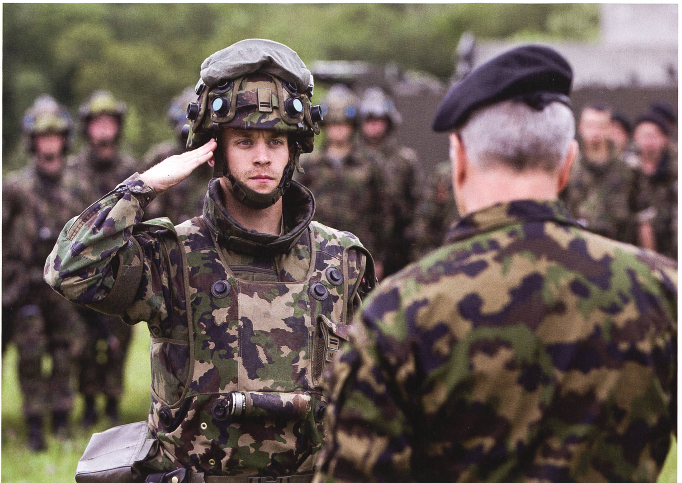
Dass blinder Gehorsam und Hierarchie zwangsweise Hand in Hand kommen, müssen auch wir AdAs aus unserem kollektiven Bewusstsein verbannen.