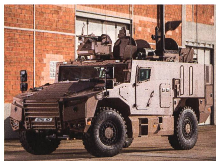
Gepanzertes Mehrzweckfahrzeug 4x4-Serval.

Das Joint Venture aus Nexter und Texelis hat die ersten leichten gepanzerten Mehrzweckfahrzeuge 4x4-Serval (véhicule blindé multi-rôles, VBMR) dem französischen Verteidigungsministerium übergeben. Wie die Unternehmen mitgeteilt ha-