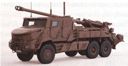
Radhaubitze CAESAR NG für Belgien.

Im Rahmen des erweiterten Programms Capacité Motorisée (CaMo) beschafft Belgien neun Radhaubitzen des Typs CAESAR NG. Der Vertrag hat ein Beschaffungsvolumen von 62 Millionen Euro. Die Haubitzen sollen ab 2027 geliefert werden. Mit CaMo lehnt sich Belgien stark an Frankreich an. Bisher sind schon