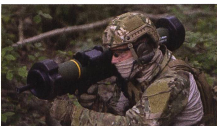
Neue Panzerfaust RGW110 HH-T von Dynamit Nobel Defence.

Dynamit Nobel Defence (DND) hat auf der Messe Eurosatory das finale Design der schultergestützten Waffe RGW110 HH-T (HEAT/HESH-Tandem) vorgestellt. Erstmals wurde die Gesamtwafe mit dem neuen Design des Griffstücks und