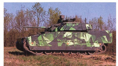
CV90 Mk IV für die slowakische Armee.