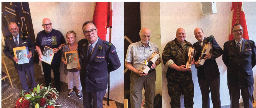
Längst überfällige Ehrungen, die aufgrund von Corona nicht haben durchgeführt werden können, wurden nachgeholt.