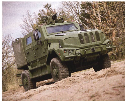
Neues Mehrzweckfahrzeug Manticore.

Im November 2019 hatte das niederländische Verteidigungsministerium bei Iveco Defence Vehicles 918 MTV in der Gewichtsklasse 12kN bestellt. Als Option waren weitere 357 Fahrzeuge vorgesehen. Iveco Defence Vehicle hat das Fahrzeug von Grund auf neu konstruiert. Ein Leiterahmen nimmt Starrachsen, Antrieb und die diversen Aufbauten auf. Ein Euro-III-Turbodiesel mit 207 kW treibt das Fahrzeug an und ermöglicht eine Höchstge-