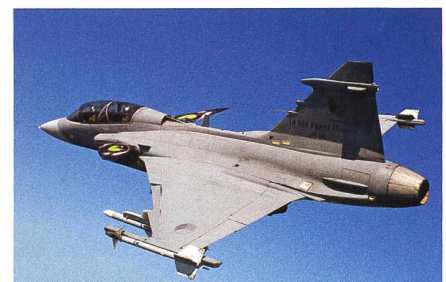
Upgrades für JAS 39 Gripen.

FMV hat ein Upgrade der zwölf einsitzigen und zwei zweisitzigen JAS 39 Gripen der tschechischen Luftstreitkräfte durchgeführt. Die Aufrüstung des tschechischen Flugzeugs JAS 39C/D mit zugehörigen Unterstützungssystemen, die von FMV (Schwedische Beschaffungsbehörde) implementiert wurde, ist ein wichtiger Bestandteil der bevorstehenden Verlegung der Gripen für das Baltic Air Policing nach Litauen. Das eigentliche Upgrade wurde