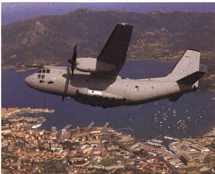
Leonardo C-27J Spartan.

Leonardo hat einen Auftrag für eine C-27J Spartan für Slowenien erhalten. Die C-27J für Slowenien wird zusätzliche Ausrüstung für medizinische Einsätze erhalten. Zudem wurden Ausbildungsleistungen und integrierte logistische Unterstützung für zwei Jahre bestellt. Die Beschaffung kostet etwa 72 Millionen Euro, welche in den Verteidigungsbudgets 2021 und 2022 untergebracht sind. Eine Lieferung wird Mitte 2023 erwartet. Die C-27J Spartan kann für militärische Transportmissionen, das Absetzen von Fallschirmjägern und