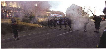
Ehrensalue der Kp 1861 am Ustertag 2021.

Am Ustertag vom 21. November 2021 war der UOV Uster mit der Compagnie 1861, der Artilleriemusik Zürich und dem Militärspiel Uster beteiligt. Unterstützt wurde das offizielle Empfangskomitee traditionell durch die Fahndedelegation der Maritzbatterie des UOV Langenthal und durch die Fahnenwache des Kantonalen Unteroffiziersverbandes Zürich & Schaffhausen. Die Feier erinnert an die Volksversammlung vom 22. November 1830,