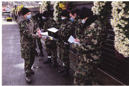
Befehlsausgabe für den Marsch.

hen durch die Stadt Schaffhausen zu verschieben. Dies war nur mittels einem Kanalmarsch, unterirdisch durch Schaffhausen, zu lösen. Vom Ausstiegspunkt beim Güterbahnhof ging es weiter zum Beringer Randenturm, wo die Anwärter diverse Posten betreiben mussten. Die Posten umfassten Zeltbau, Grabenfeuer, Kochen und SNORDA.