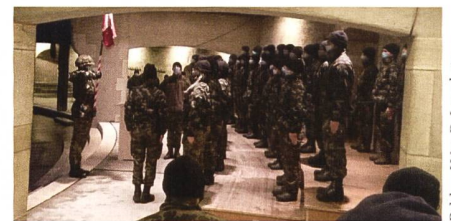
Müde aber stolz: Beförderung der frisch gebackenen Unteroffiziere im Schaffhauser Munot.

zum Munot an, wo die Anwärter (Soldaten) in einem schlichten, aber sehr würdigen Beförderungsakt durch Oberst i Gst Ineichen zu Wachtmeistern befördert wurden. In seiner Ansprache hat der Kdt, Oberst i Gst Ineichen, den neuen Wm mitgegeben, wie wichtig die «4 M» für Kader sind («Man muss Menschen mögen»). Anschliessend wurden die frischgebackenen Wm nach einem Nachtessen auf dem Munot motorisiert nach Dübendorf verschoben.