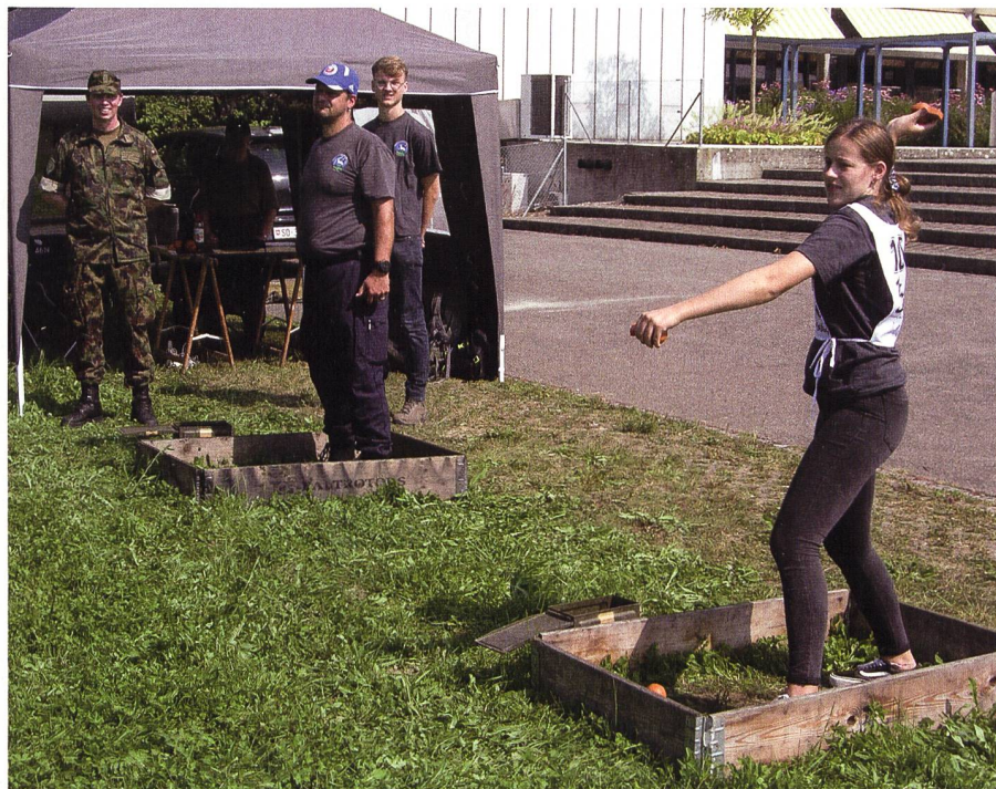
Posten HG-Wurf: Das gibt einen Treffer!