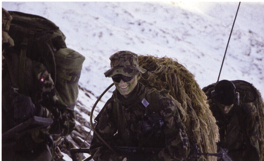
Späher beim Aufstieg auf den Pass.

Der Weg war beschwerlich und der Marsch anspruchsvoll. Sowohl die Soldaten, als auch die Pferde mussten sich konzentrieren, immer wieder versank man im Schnee oder rutschte aus. Als es einzudunkeln begann, war das Häxenseeli bereits passiert und somit der schwierigste Teil der Strecke geschafft.