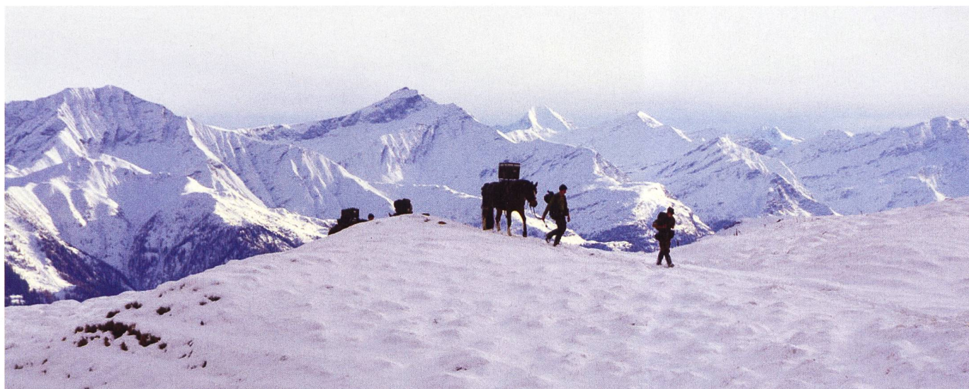
Ankunft des Train's im gesicherten Halt.