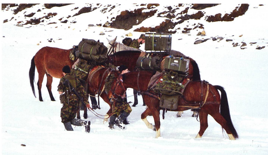
Am Link Up (Treffpunkt Train und Klasse 3).