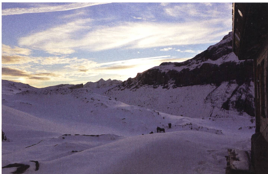
Abendstimmung auf dem Panixerpass.

Trotzdem erforderte der Abstieg vollste Aufmerksamkeit von allen, sowohl von den Pferdeführern, als auch von den Pferden. Doch die Tiere leisteten ganze Arbeit und transportierten das Material sicher bis zum Schiessplatz Wichlenalp.