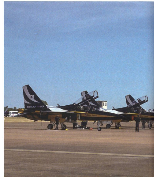
Das Black-Eagles-Team fliegt mit acht KAI T-50 bei den Startvorbereitungen.