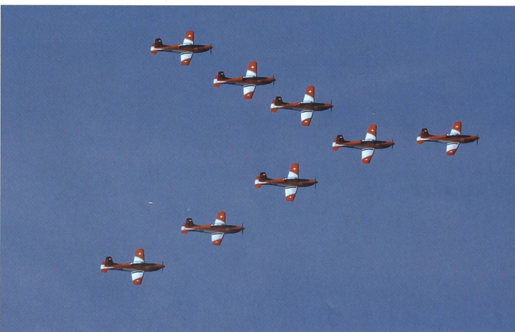
Das PC-7 Team begeisterte das Publikum in Fairford mit präzisen und schönen Displays.