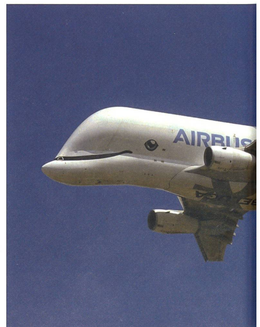
Die Beluga von Airbus, das spezielle Flugzeugbauteilen eingesetzt.