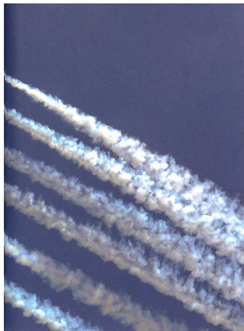
zeigte ein eindruckliches Flugprogramm und führung ausgezeichnet.