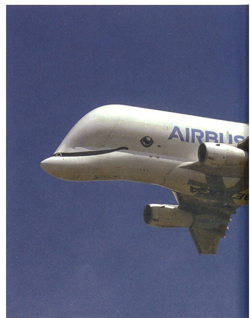
Die Beluga von Airbus, das spezielle Flugzeugbauteile eingesetzt.