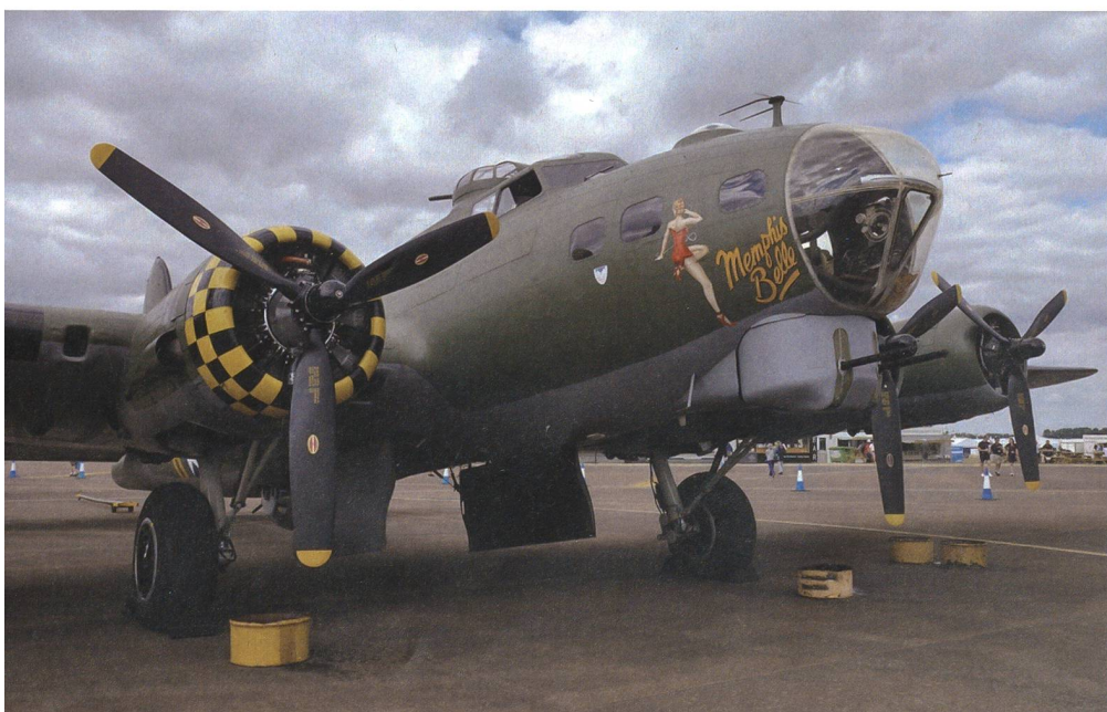
Auch schöne Oldtimer wie hier die B-17 G Flying Fortress durften nicht fehlen.