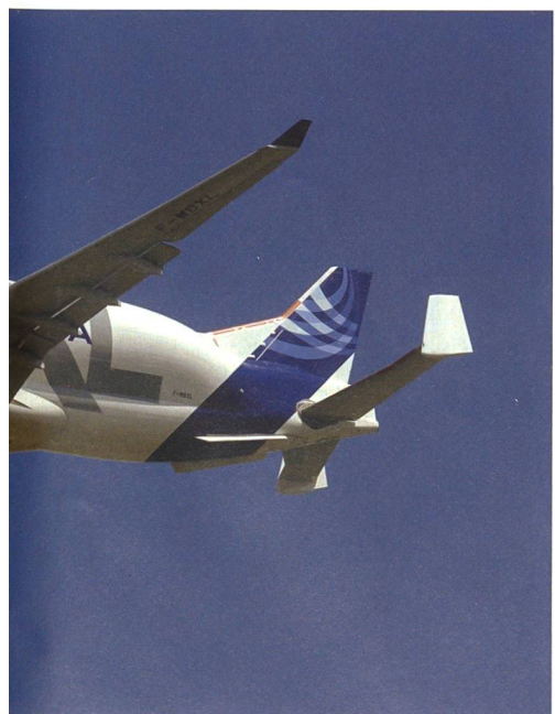
ird für den Transport von grossen Flugzeug-