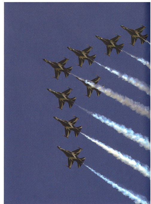
Die Kunstflugstaffel Black Eagles aus Südkorea wurde dafür mit der Trophy für die beste Vorführung ausgezeichnet.