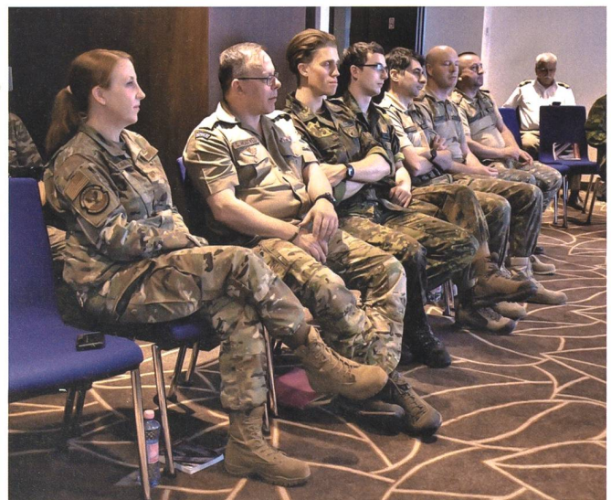
Die Organisatoren wollen dazu beitragen, dass die stark verkleinerten Streitkräfte nicht den Kontakt mit der Gesellschaft verlieren.