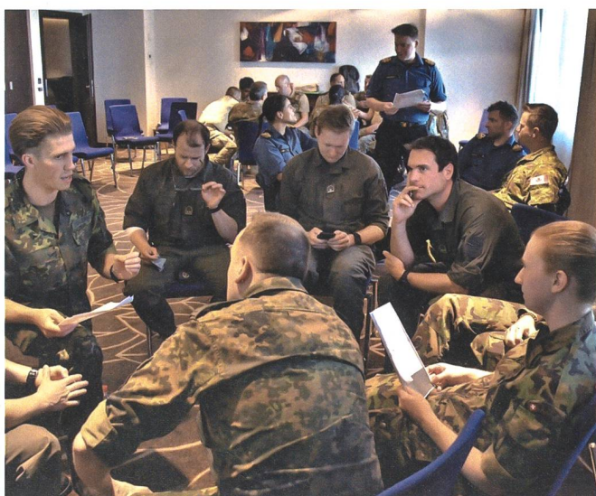
Offiziere aus elf Nationen werden sich am Samstag, 8. Oktober, in Stans einfinden.