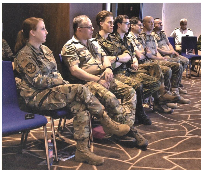
Die Organisatoren wollen dazu beitragen, dass die stark verkleinerten Streitkräfte nicht den Kontakt mit der Gesellschaft verlieren.