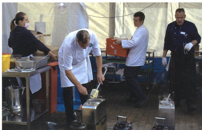
Die Feldküche entstammt dem Bestand der Schweizer Armee.