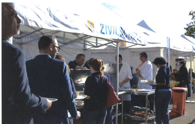
Um den Ernstfall, inklusive Material zu erproben, fand am 25. Oktober im Spital Muri ein «Feldküchen-Testlauf» statt.