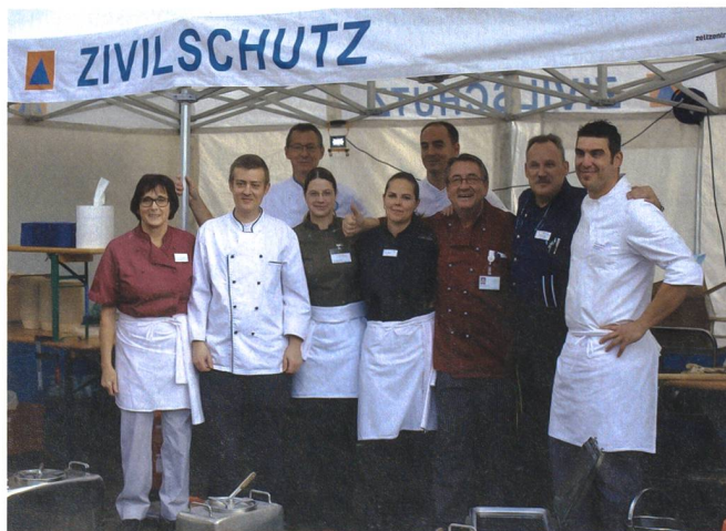
Vielen Dank an das Team vom Testlauf-Anlass, den Küchenchefs der Heime.