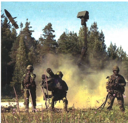
Saab RBS-70 MANPADS.

Die litauischen Streitkräfte beschaffen moderne Lenkflugkörper für das Saab RBS-70 MANPADS (Man-Portable Air-Defense System). Dies gab die litauische Beschaffungsagentur bekannt. Der Vertrag im Wert von 45 Millionen Euro umfasst Lenkflugkörper der Version RBS-70 Mk-2 und RBS-70 Bolide. Litauen verwendet mehrere Arten von MANPADS, dazu zählen neben der FIM-92 Stinger und der aus polnischer Fertigung stammenden Grom auch die von Saab Bofors Dynamics gefertigten RBS-70 Systeme. Bereits 2018 erfolgte eine Modernisierung der Startgeräte auf den RBS-70 NG (New Generation) Stand. Hierdurch wurde die Feuerleiteinheit deutlich verbessert und die Nachtkampffähigkeit durch ein Wärm