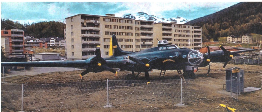
1972: der Zugerseebomber mit neuem Anstrich in St. Moritz-Bad, neben dem Hotel Sonne. Auch der Übername «Lonesome Polecat» ist nun aufgemalt.