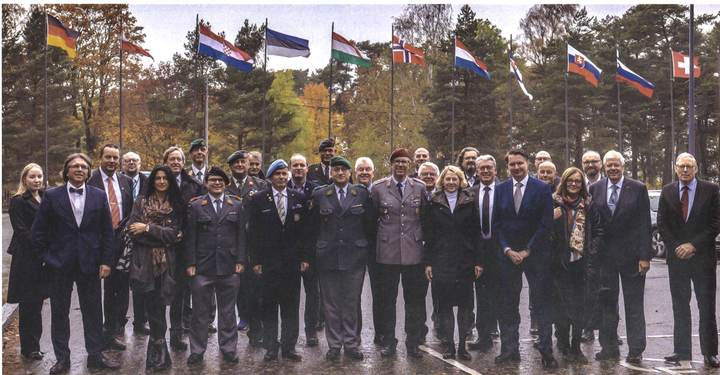
Über 30 Vertreter der wichtigsten Medien im Bereich Verteidigung und Militär aus 10 Ländern reisten an den diesjährigen Kongress nach Finnland.

Vor Ort wurde den EMPA-Mitgliedern vor allem die modernisierte Ausbildung