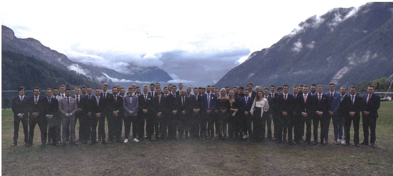
Delegation der Alumni ED! am Vierwaldstättersee.