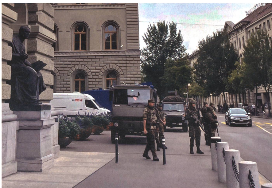
Präsenz zeigen, auch in Bundesbern: Schweizer Soldaten während FIDES.