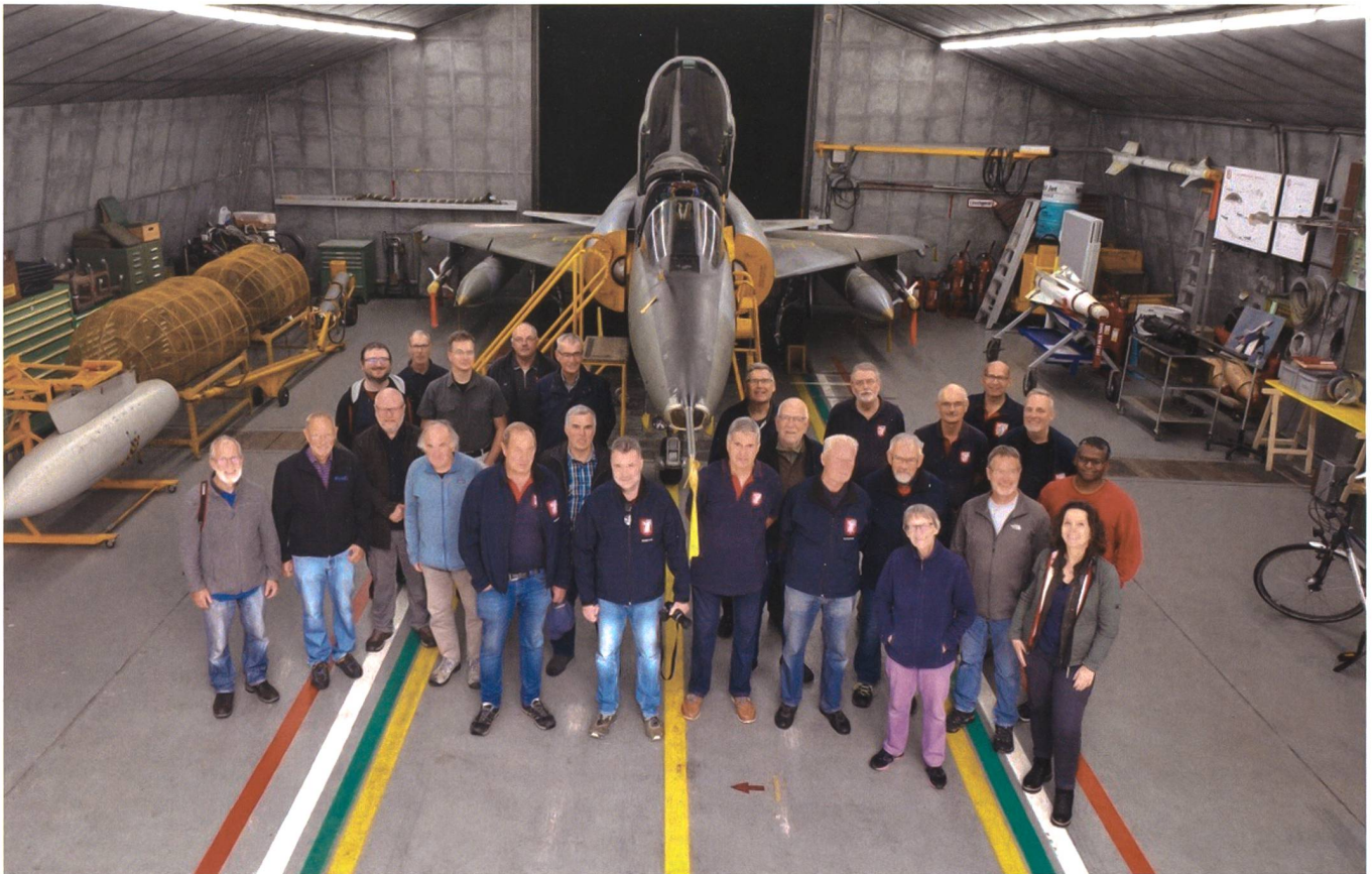
Der Mirage-Verein Buochs hat sich zum Ziel gesetzt, die 40 Jahre dauernde Ära des erfolgreichen Kampfflugzeuges MIRAGE III in der Schweiz in bescheidener materieller, vor allem aber in ideeller Form weiterzuführen.

und insgesamt neu 7500 Schweizer Franken pro Jahr auf die Seite stellen», erklärte Borgeaud. Dies sei ein existenzgefährdender und unsicherer Weg für den Verein.