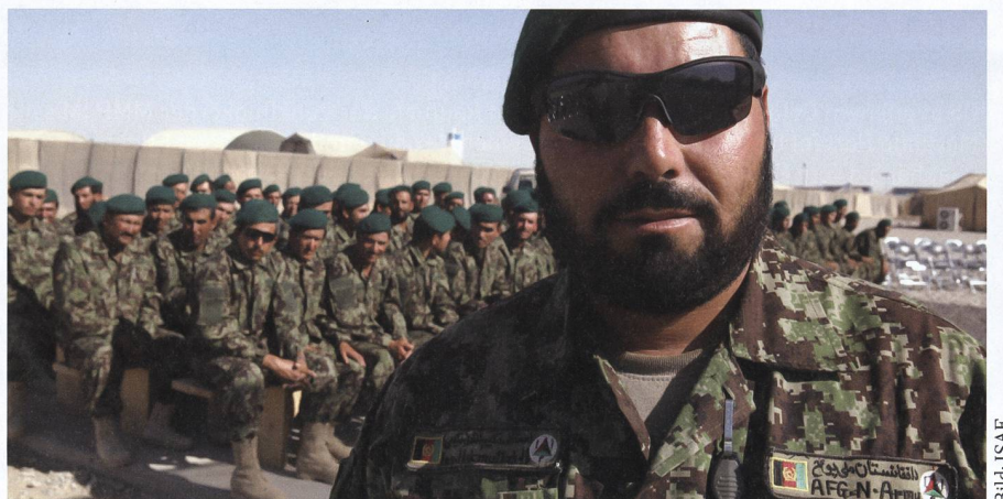
Das Scheitern der ANA ist auch das Scheitern der 20-jährigen NATO-Mission in Afghanistan.