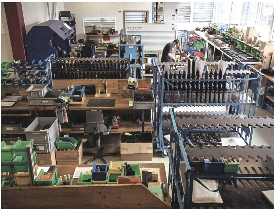
Das moderne Firmengebäude der Firma B&T AG bietet den Mitarbeitenden eine moderne Infrastruktur, welche hilft, Spitzenleistungen zu erzielen.